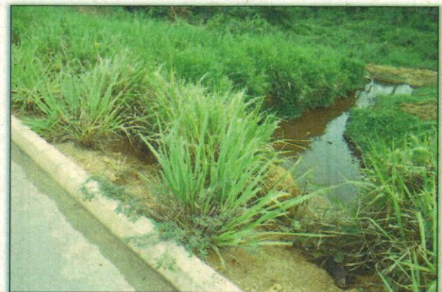
Foto 01 - Hidrossemeadura cobrindo a erosão na saia do aterro.