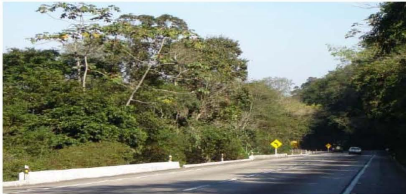
FOTO DO LOCAL