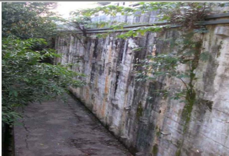
FOTO DO LOCAL