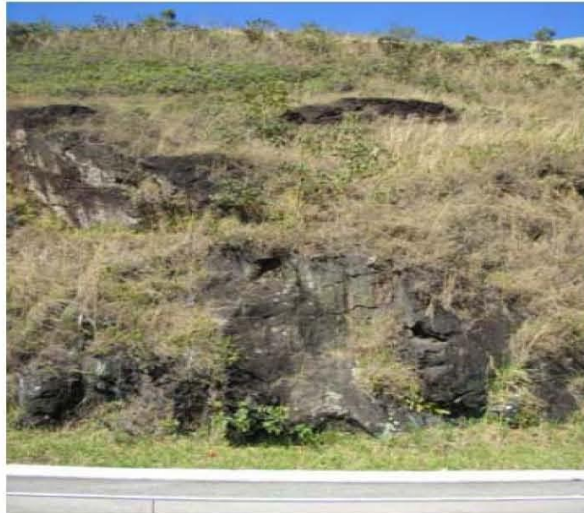
FOTO DO LOCAL