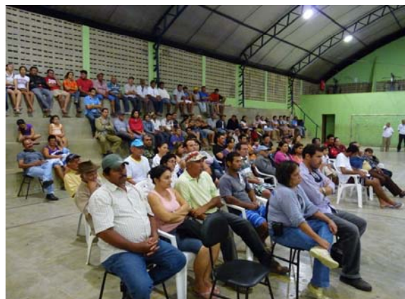
Foto 02. Primeira Audiência Pública do Plano Diretor Participativo de São Domingos do Cariri-PB.