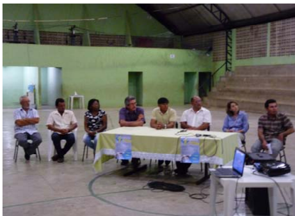
Foto 01. Primeira Audiência Pública do Plano Diretor Participativo de São Domingos do Cariri-PB.