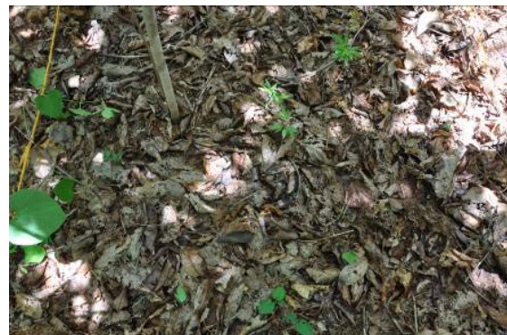
Solo recoberto por foliço na jazida 10 - TRECHO II - LOTE 06.