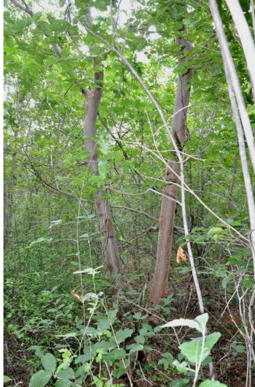
Croton sonderianus Müell. Arg.