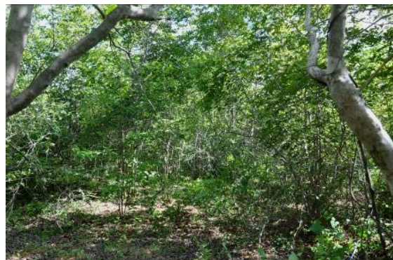
Perfil horizontal da comunidade na jazida 11 - Trecho II - LOTE 06, evidenciando os componentes arbóreos, arbustivos e herbáceos. Solo recoberto por folhiço.