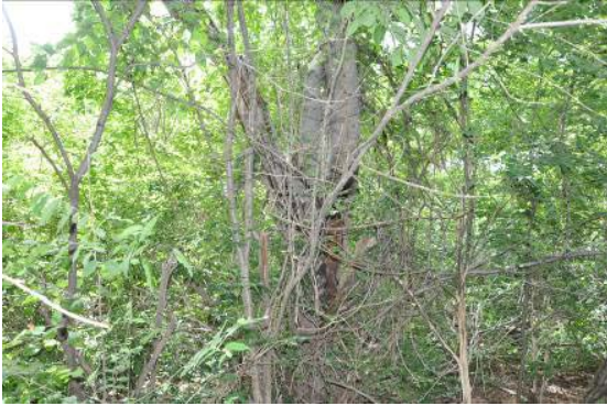
Croton sonderianus Müell. Arg.