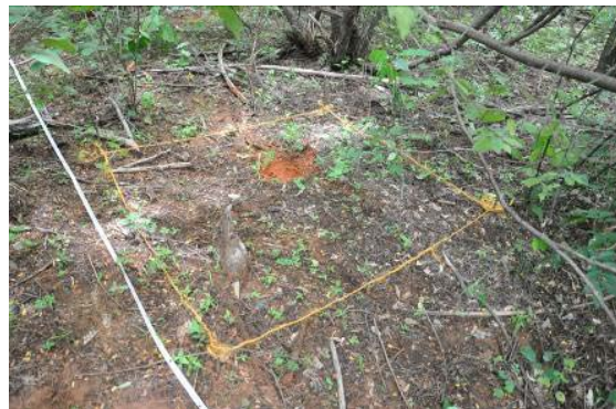
Delimitação das parcelas para levantamento das espécies herbáceas. Com linha laranja evidenciando os limites da parcela de 1x1 m. Linha do transecto para levantamento arbóreo e arbustivo em evidência, demonstrado pela linha branca.