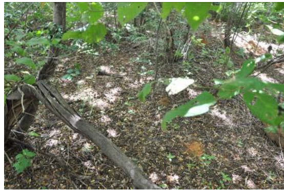
Solo recoberto por foliço.