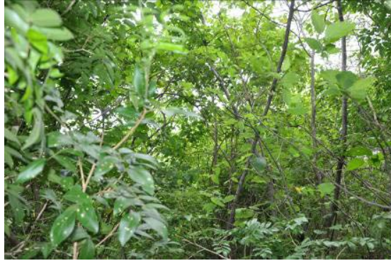
Trichidium cf. molle (Benth.) H.E. Ireland