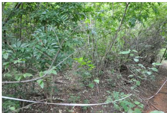
Transecto de 50 metros demarcando a linha de caminhada. O Transecto encontra-se em uma trilha aberta pela população local