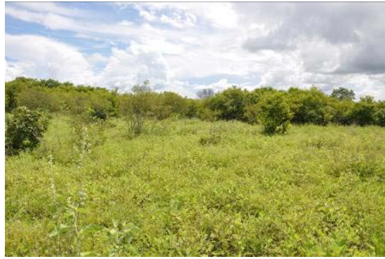
Entrada para área testemunha da jazidas 07 e 08, evidenciando desmate.