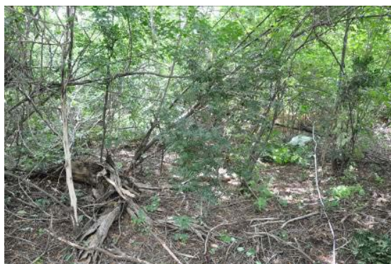
Perfil horizontal da comunidade nas jazidas 07 e 08 - Lote 06, Trecho II, evidenciando os componentes arbóreos, arbustivos e herbáceos