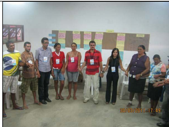
Foto 08: Encerramento da capacitação – Módulo VII, na VPR Pilões.