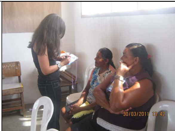
Foto 01: Credenciamento dos participantes da capacitação – Módulo VII.