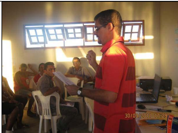
Foto 07: Apresentação da Carta de Compromisso dos Grupos de Responsabilidade.