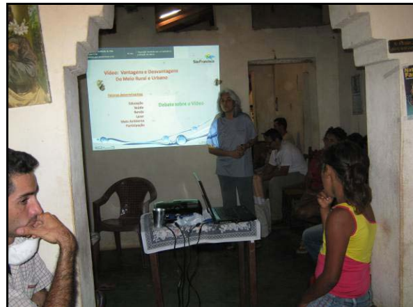
Foto 02: Facilitação do debate sobre o vídeo e apresentação dos dados socioeconômicos.