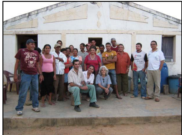
Foto 07: Futuros reassentados e técnicos da CMT participantes da capacitação