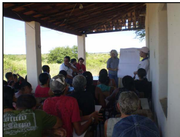
Foto 02. Capacitação em ética com os reassentados da VPR Negreiros.