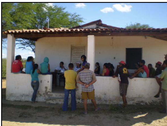
Foto 01. Capacitação em Ética com os reassentados da VPR Negreiros.

Por fim, a comunidade aproveitou a oportunidade e definiu os nomes dos moradores para comporem a chapa única para a Diretoria Executiva e para o Conselho Fiscal da Associação dos Moradores da VPR Negreiros.