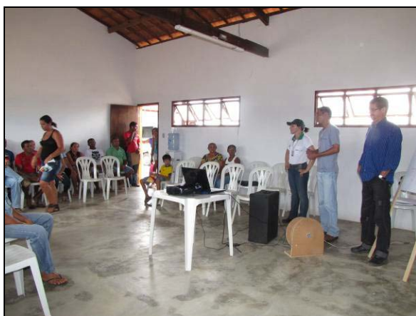
Foto 01: Apresentação da programação e da equipe de capacitação (20/01/2011).