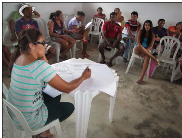
Foto 06: Trabalho em grupo – elaboração do Código e de Convivência Coletiva (20/01/2011).