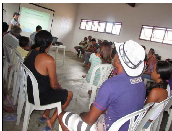
Foto 02: Apresentação e debate sobre o vídeo "o gladiador" (20/01/2011).