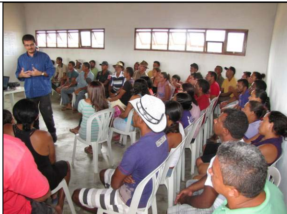
Foto 03: Exposição oral sobre os princípios éticos para convivência em sociedade (20/01/2011).