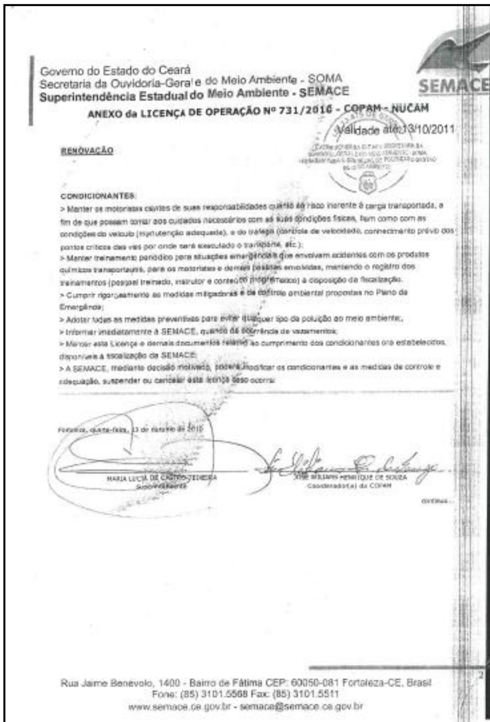
Figura 16 – Cópia da licença de operação da LOCABAN