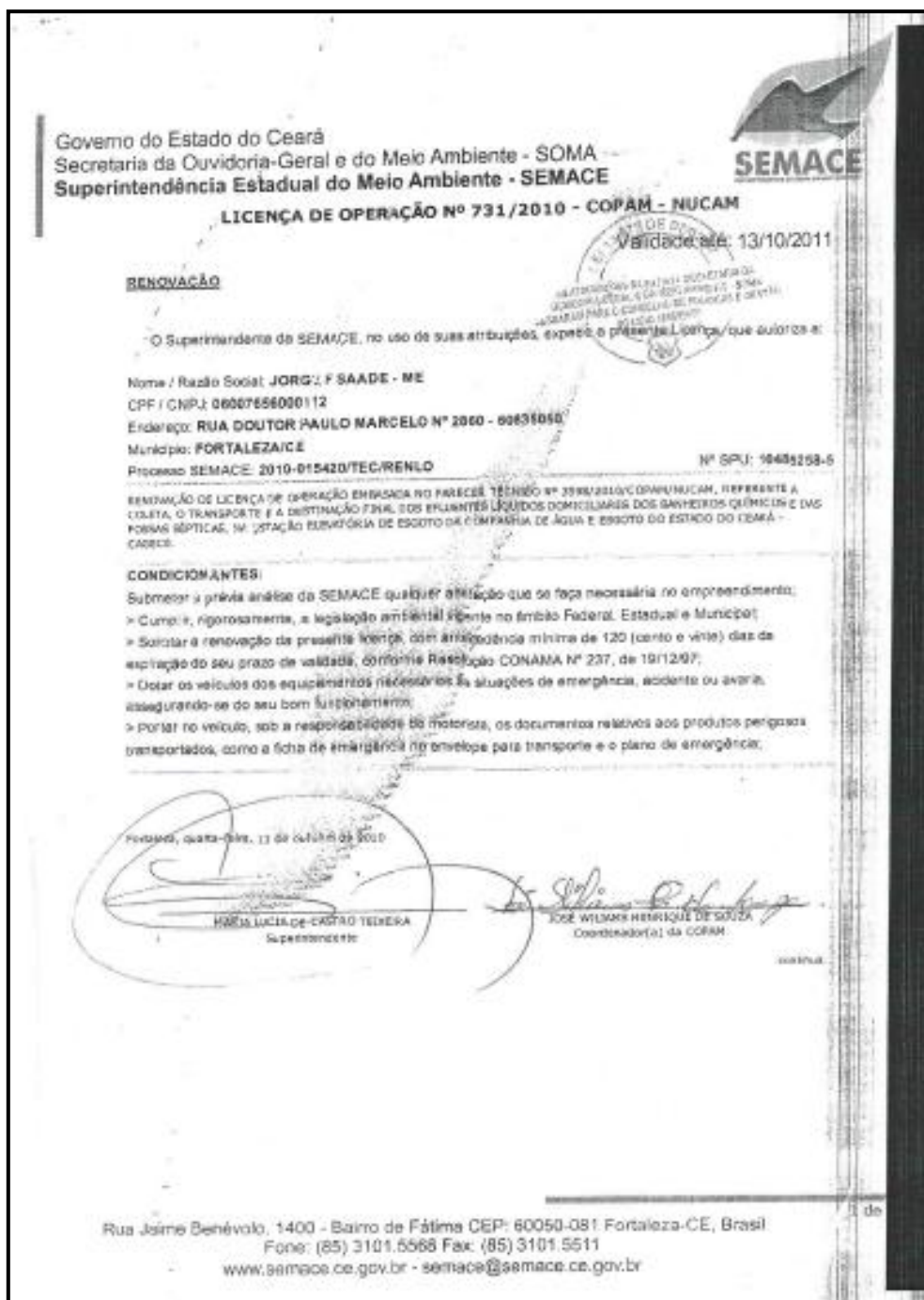
Figura 15 – Cópia da licença de operação da LOCABAN