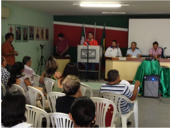
Foto 01. Terceira Audiência Pública do Plano Diretor Participativo de Itajá – RN, em 17/09/2013.