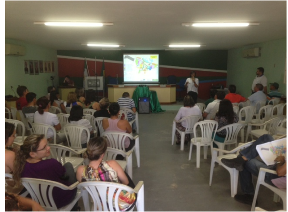
Foto 02. Terceira Audiência Pública do Plano Diretor Participativo de Itajá – RN, em 17/09/2013.