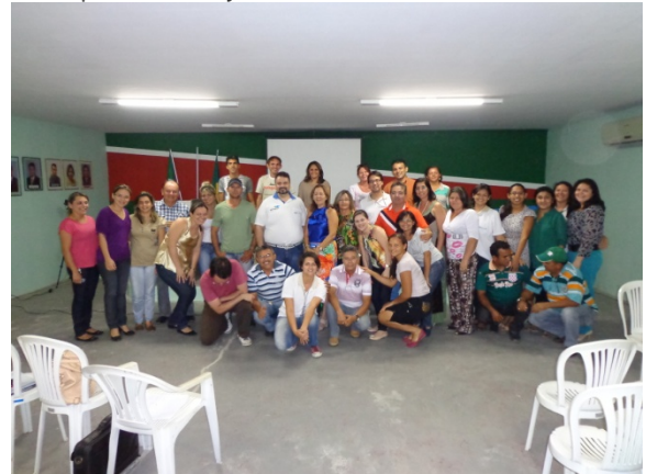
Foto 02. Terceira Audiência Pública do Plano Diretor Participativo de Itajá – RN, em 17/09/2013.