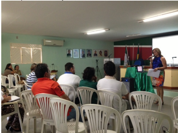
Foto 01. Terceira Audiência Pública do Plano Diretor Participativo de Itajá – RN, em 17/09/2013.