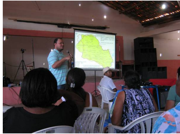
Foto 02: Realização da 2ª Audiência Pública de Mirandiba - PE, para apresentação e discussão do Diagnóstico Municipal, em 27/09/2013.