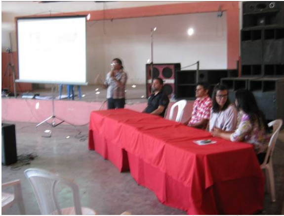
Foto 01: Realização da 2ª Audiência Pública de Mirandiba - PE, para apresentação e discussão do Diagnóstico Municipal, em 27/09/2013.