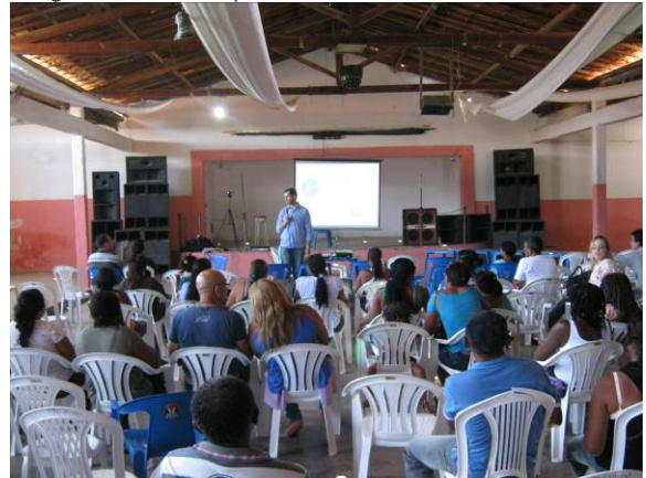
Foto 04: Realização da 2ª Audiência Pública de Mirandiba - PE, para apresentação e discussão do Diagnóstico Municipal, em 27/09/2013.