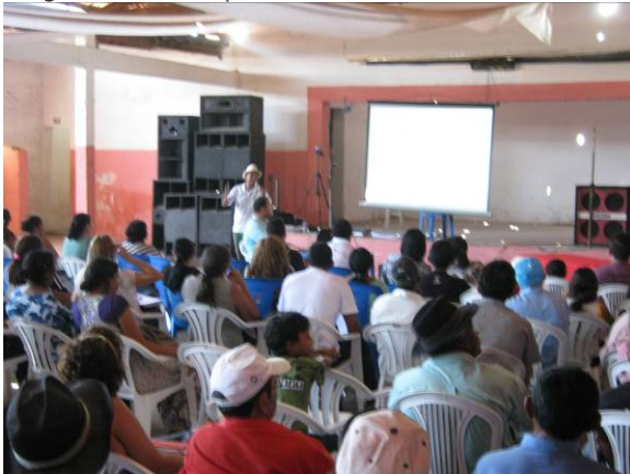
Foto 03: Realização da 2ª Audiência Pública de Mirandiba - PE, para apresentação e discussão do Diagnóstico Municipal, em 27/09/2013.