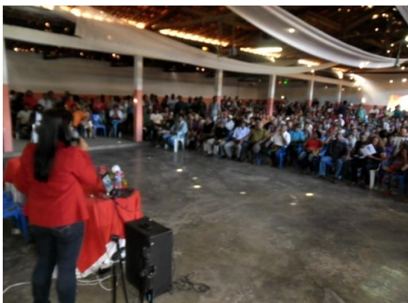
Foto 01. Primeira Audiência Pública do PDP de Mirandiba – PE, em 04/07/2013.