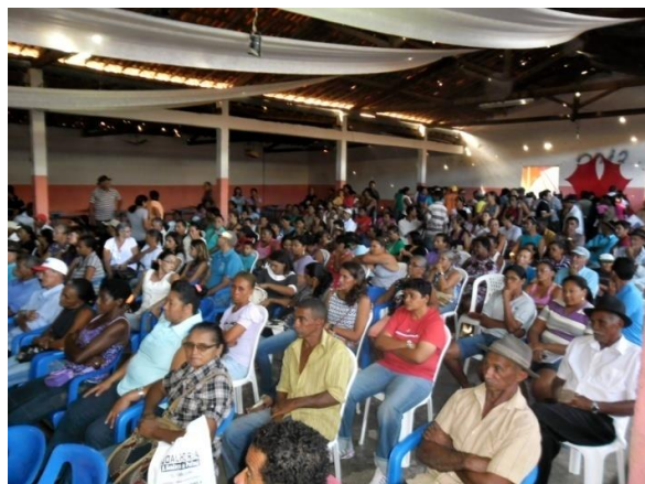
Foto 04. Primeira Audiência Pública do PDP de Mirandiba – PE, em 04/07/2013.