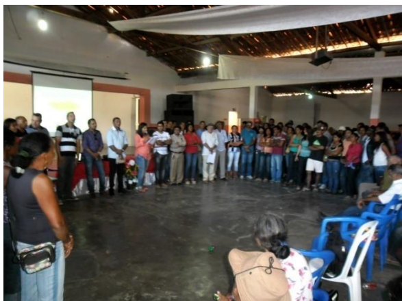
Foto 03. Primeira Audiência Pública do PDP de Mirandiba – PE, em 04/07/2013.