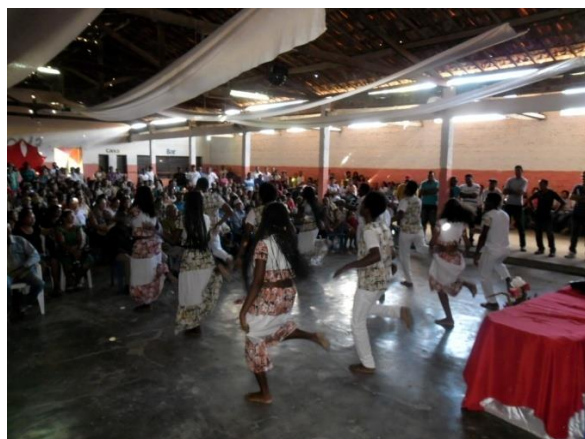
Foto 02. Primeira Audiência Pública do PDP de Mirandiba – PE, em 04/07/2013.