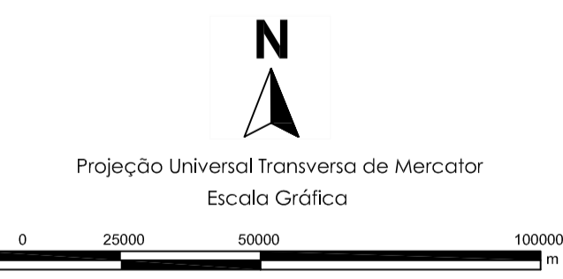
Origem da quilômetros: Equador e Meridiano Central 39°W.Gr. acrescida das constantes N 10.000km e 500km, respectivamente. Datum horizontal: SAD-69