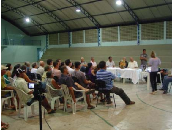
Foto 01. Terceira Audiência Pública do PDP de São Domingos do Cariri, para apresentação e discussão das propostas para o município.