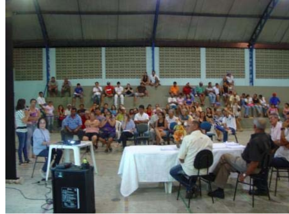
Foto 02. Terceira Audiência Pública do PDP de São Domingos do Cariri, para apresentação e discussão das propostas para o município.