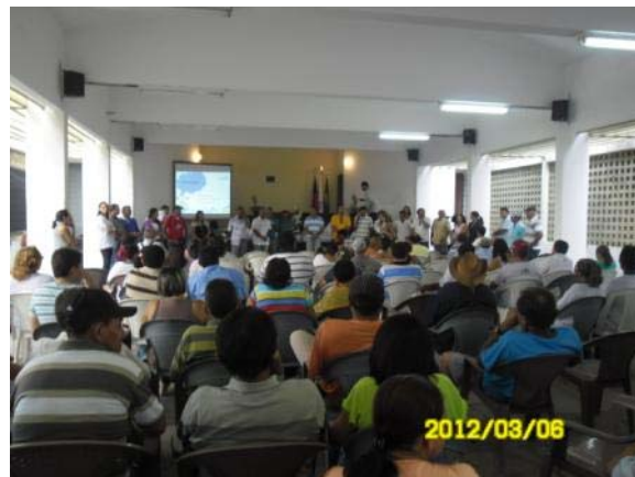
Foto 02. Apresentação do Núcleo Gestor do Plano Diretor Participativo de Santa Helena – PB para a população.