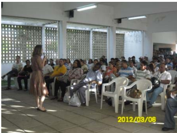
Foto 01. A Coordenadora do Programa de Apoio Técnico às Prefeituras apresentando o PDP durante a Primeira Audiência Pública de Santa Helena – PB.