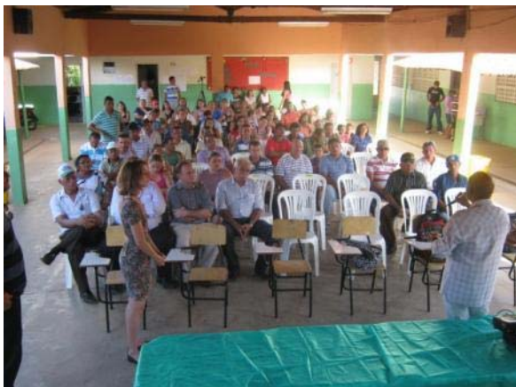
Foto 01. Primeira Audiência Pública do Plano Diretor Participativo de Marizópolis - PB.