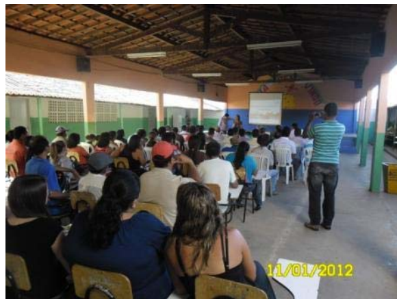
Foto 02. Primeira Audiência Pública do Plano Diretor Participativo de Marizópolis - PB.