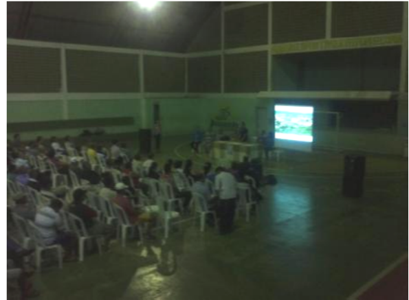
Foto 02. Primeira Audiência Pública do Plano Diretor Participativo de Boqueirão - PB.