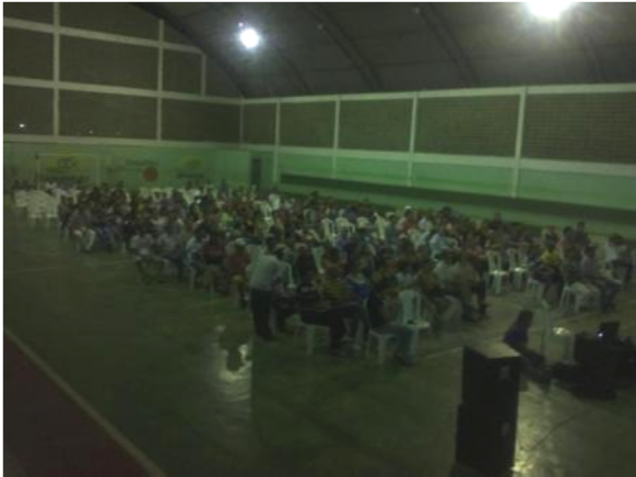
Foto 01. Primeira Audiência Pública do Plano Diretor Participativo de Boqueirão - PB.