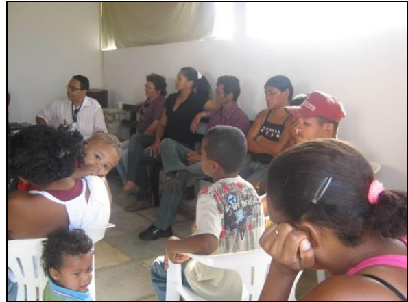
Foto 02 – Participação da comunidade que será reassentada na VPR.

Em seguida abriu-se espaço para discussões entre palestrante e participantes sobre o tema abordado, de forma a esclarecer dúvidas e internalizar conceitos.