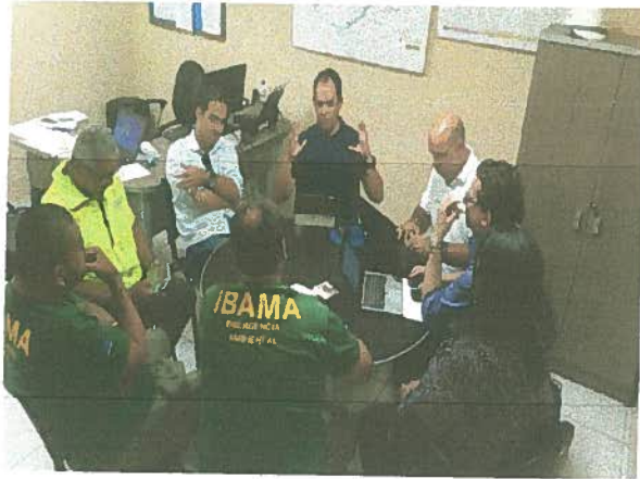
Reunião entre Ministério da Integração Nacional, IBAMA/PE, Consorcio CBSF, Gerenciadora e CMT Engenharia Eireli.