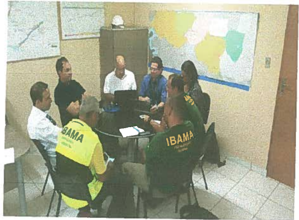
Reunião entre Ministério da Integração Nacional, IBAMA/PE, Consorcio CBSF, Gerenciadora e CMT Engenharia Eireli.

[Handwritten signatures and initials in blue ink]