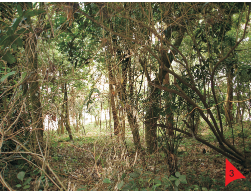
Grande parte da área caracteriza-se pela declividade acentuada, com boa visibilidade.