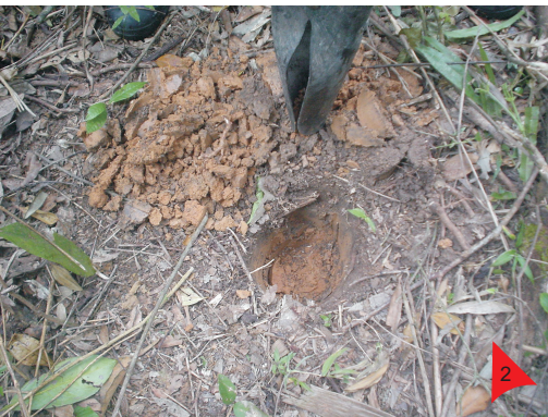
Sondagem D4. A prospecção subsuperficial foi executada nos locais mais planos, onde poderia ter ocorrido ocupação humana pretérita.