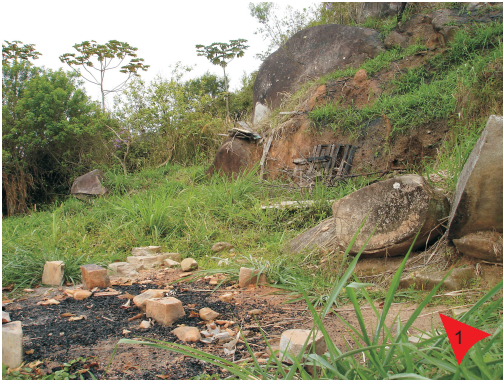
A faixa de praia encontra-se alterada, com cortes de barranco, devido à ocupação desordenada do local.