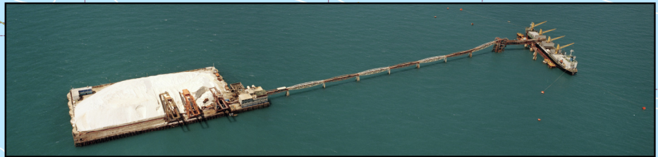
Fotografia - Terminal Salineiro de Areia Branca.