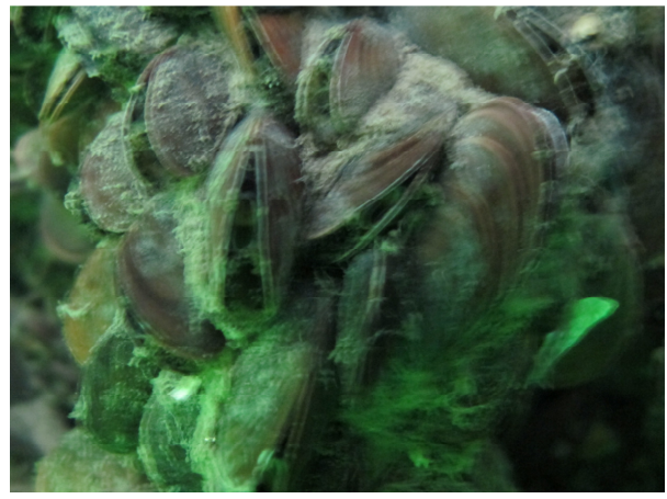
Figura 2. Fotos dos mergulhos sob píer e de organismos associados