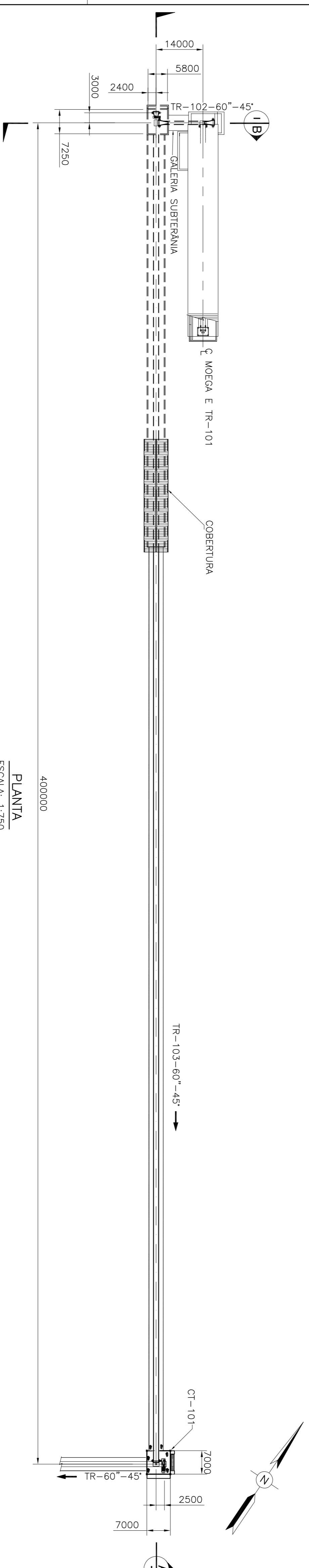
PLANTA ESCALA: 1:750