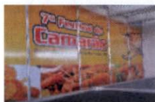
5 - PEÇAS GRÁFICAS E CENOGRÁFICAS