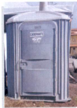
Banheiros químicos para pessoas com necessidades especiais