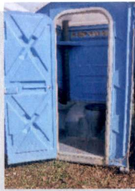
Banheiros químicos comuns (M/F)