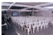
6 - EQUIPAMENTOS, SERVIÇOS E ITENS DE APOIO