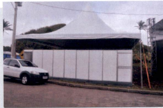
Estande de palestras