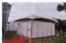
1 - TENDAS DE APOIO

A montagem das estruturas teve início no dia 28 de agosto de 2013. Foram montados no espaço do evento: palco, banheiros químicos, lavabos e tendas para camarim, palestras e estandes de alimentação.