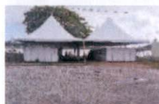
2 - TENDAS PARA RESTAURANTE E COZINHA