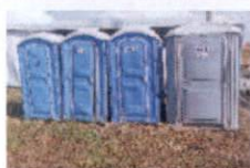
4 - BANHEIROS QUÍMICOS E LAVABOS