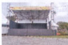
3 - PALCO