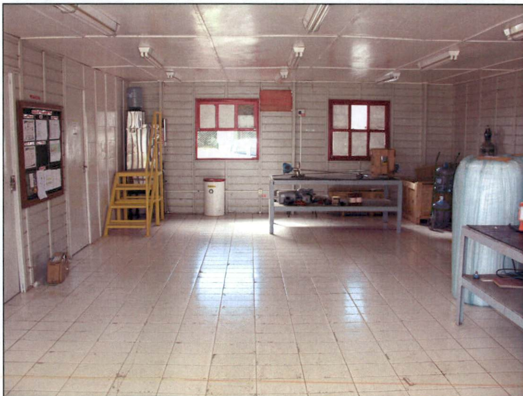
Foto 04 – Vista geral de umas das salas do galpão administrativo.