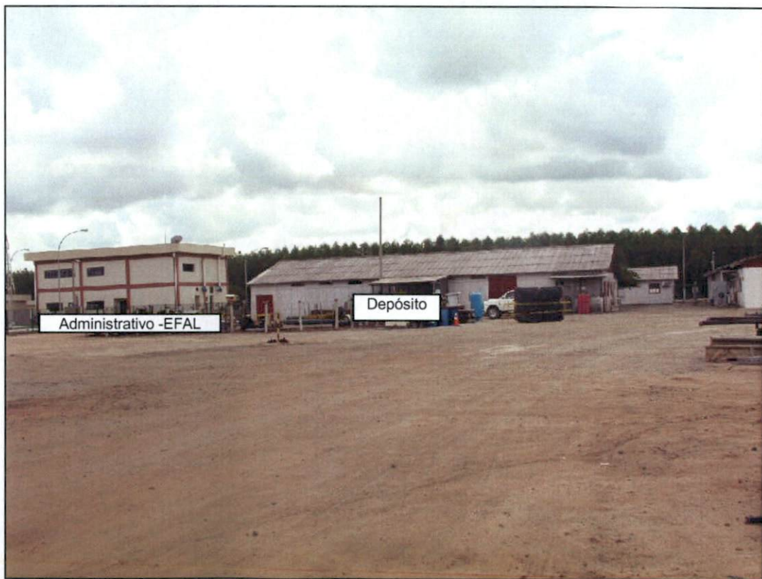
Foto 14 – Foto demonstrando proximidade dos galpões com o prédio Administrativo da Estação de Fazenda Alegre.