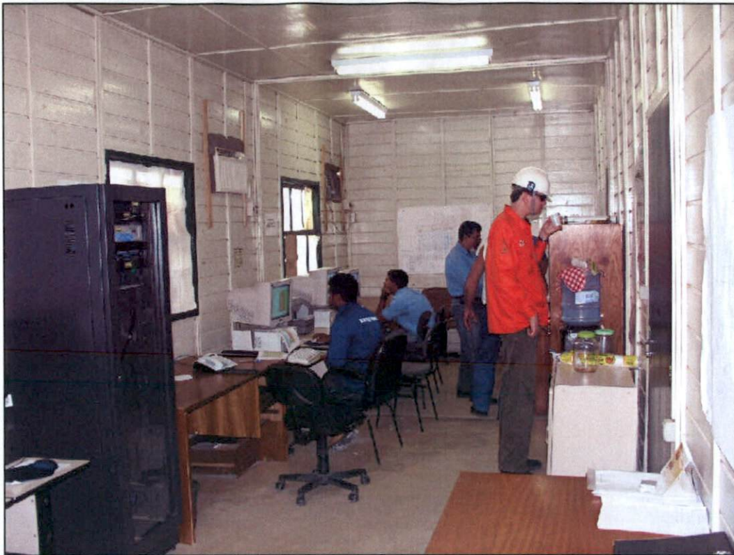
Foto 19 – Sala de planejamento administrativo das atividades gerais do galpão.