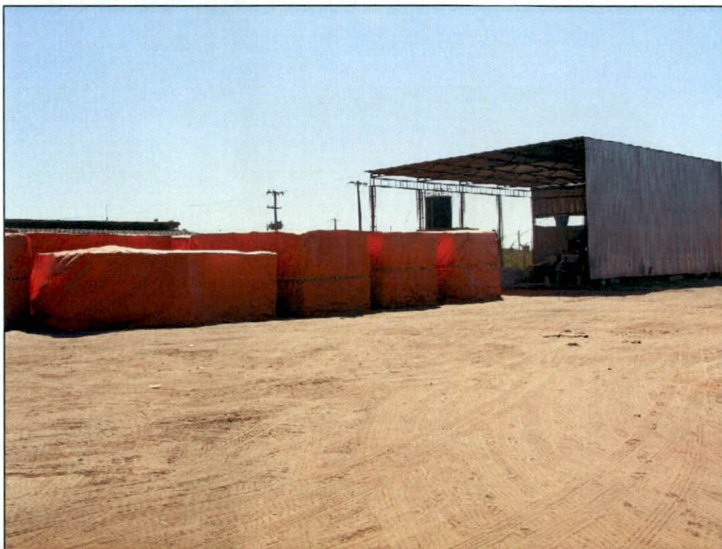
Foto 20 – Vista do galpão de armazenamento localizado atrás do galpão da ISUP e de material aguardando para utilização protegido de intempéries.