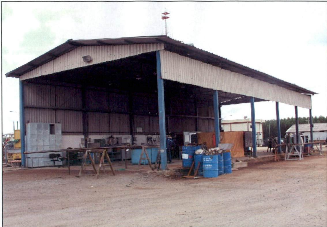
Foto 11 – Vista geral do galpão onde está instalada a oficina de solda.