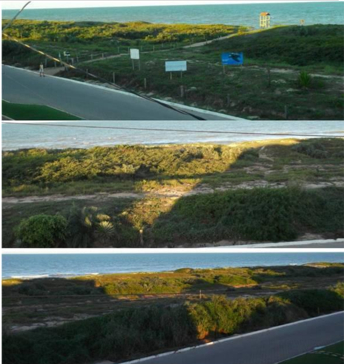
Figura VI -2– Imagens da área de monitoramento em maio de 2013.