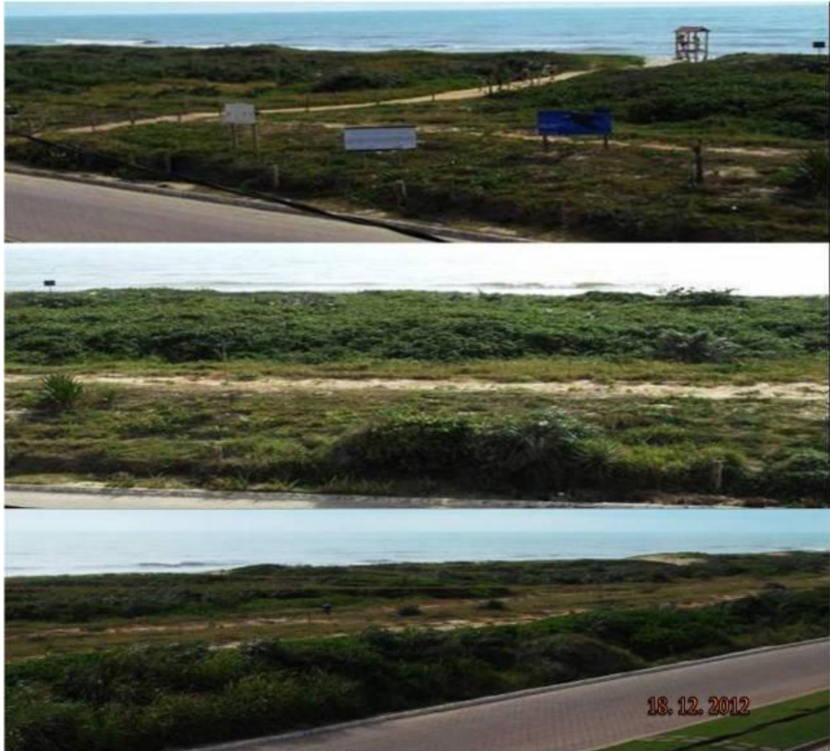
Figura VI -1- Imagens da area de monitoramento em dezembro de 2012.