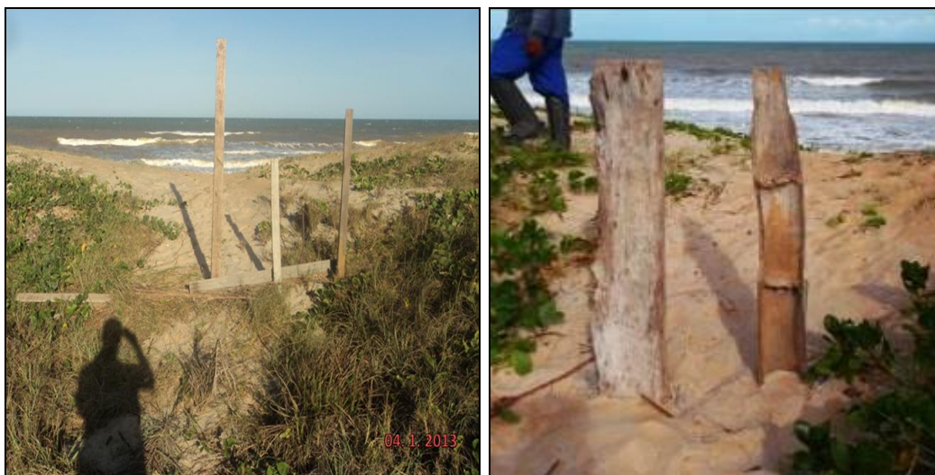
Figura III 3-4 – Obstáculos colocados na passagem de banhista, a fim de diminuir a entrada de pessoas e carros na área.

Não foi usado adubo químico de cobertura uma vez que foi constatado em campo, que a adubação estava ocasionando a morte de muitos indivíduos. Tal fato é confirmado pela literatura. Pois a mesma cita que a vegetação de restinga é uma vegetação adaptada a solos pobres, com baixos teores de nutrientes. O que é corroborado por Primavesi 1999, onde cita que em solos arenosos, como no caso da restinga, ocorre o processo de podzolização, na qual há a percolação da água no solo dando formação a uma camada branca abaixo de tudo que é acumulado e lavado do solo superior, húmus, cátions e óxidos de ferro, tornando o solo pobre e ácido.