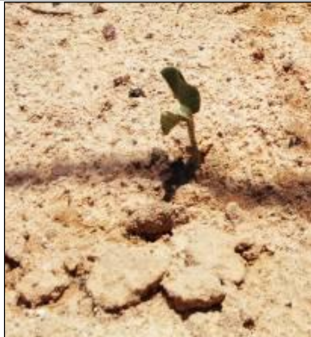
Figura III 5-5 – Plântula de Canavalia rósea proveniente da sementeira direta.

Além dos números mostrarem um satisfatório desenvolvimento da revegetação da área. Pode-se observar também o aumento da população de corujas buraqueiras (Figura III 5-6) e o surgimento de indivíduos vegetais que não foram plantados no início do projeto como é o caso do Guriri e o cacto (Figura III 5-7), que hoje estão presentes na área.