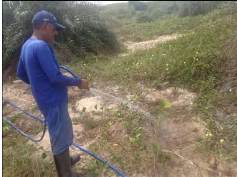
Figura III. 3-2 – Irrigação manual das mudas.