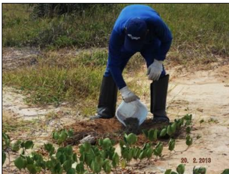
Figura III. 3-1 – Colocação de matéria morta nas covas, pelo funcionário da SCITECH.