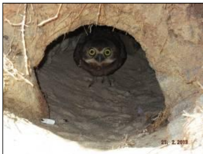
Figura III 5-6 – Indivíduo jovem de coruja buraqueira.

Além dos números mostrarem um satisfatório desenvolvimento da revegetação da área. Pode-se observar também o aumento da população de corujas buraqueiras (Figura III 5-6) e o surgimento de indivíduos vegetais que não foram plantados no início do projeto como é o caso do Guriri e o cacto (Figura III 5-7), que hoje estão presentes na área.