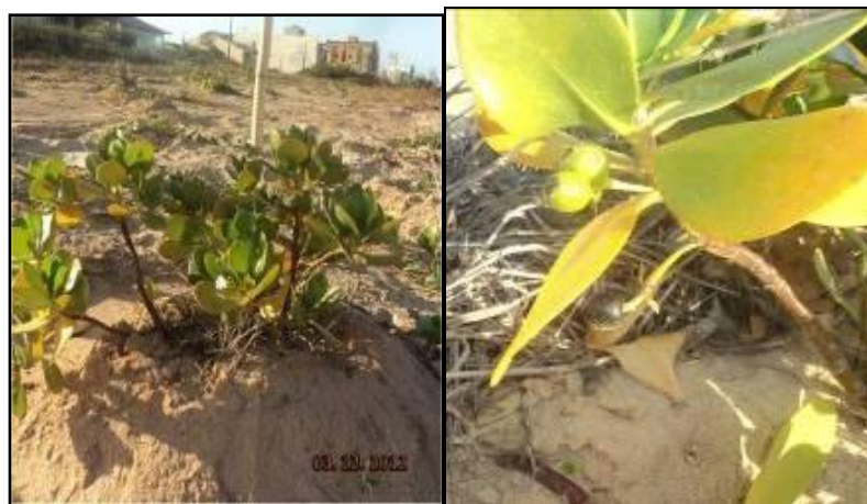
Figura III. 2-1 – Indivíduos plantados em floração e frutificação na praia de Guriri.

Como referência da situação satisfatória de crescimento/estabelecimento das espécies do plantio está a formação de flores e frutos nos indivíduos (Figura III. 2-1), demonstrando a existência de condições para o prosseguimento dos processos biológicos dos vegetais.