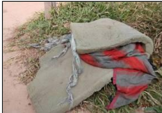
Figura III 3-3 – Resíduos retirados de dentro da área de manutenção.