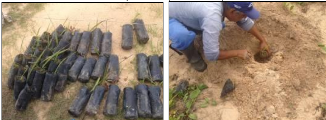
Figura III. 4-2 –. Mudanças de Allagoptera arenaria (Guriri) esperando o plantio (Foto a esquerda) e o plantio das mesmas (foto a direita).

Importante ressaltar que das 11 espécies ( Tabela III 4-1 ) plantadas todas são encontradas na restinga do norte capixaba (PEREIRA & GOMES, 1994; PEREIRA et al. , 1998), com destaque para espécimes de Schinus terebinthifolius , Dalbergia ecastophyllum , Eugenia adstringes (= Eugenia cassinoides ), Guapira pernambucensis e Allagoptera arenaria que são táxons reconhecidos como importantes na estrutura da comunidade arbustiva fixadora de dunas situada próxima ao mar (FABRIS et al. 1990; ASSIS et al. 2000).