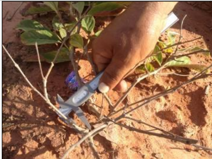
Figura III. 5-1– Medições do DAS utilizando paquímetro.

A taxa de mortalidade foi baixa (11%), uma vez que é normal encontrar valores entre 10% e 20% após o plantio (MARTINS, 2001; ALMEIDA, 2001). Zamith & Scarano (2006) obtiveram taxas de mortalidade de 18,1% em um plantio com espécies nativas para restauração de uma área de restinga, demonstrando que os resultados obtidos no replantio na praia de Guriri podem ser considerados satisfatórios.