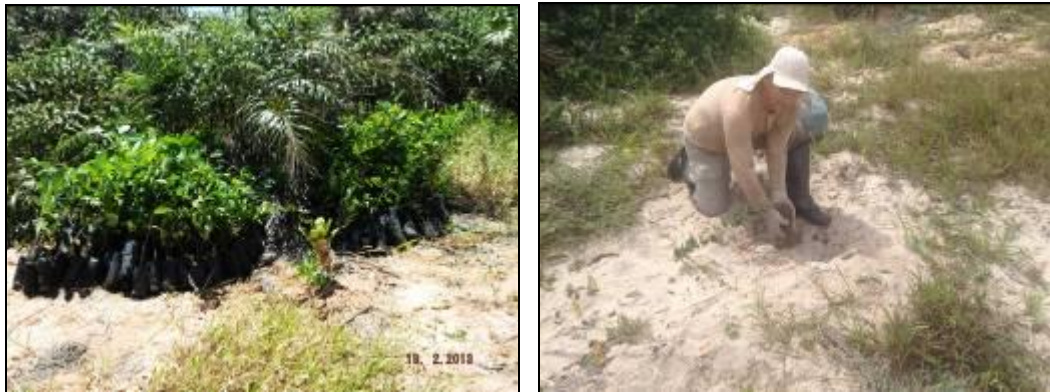
Figura III. 4-1. –. Mudanças na área esperando o plantio (Foto a esquerda) e mudas sendo plantadas (Foto a direita).

manutenção e irrigação dos indivíduos, tendo em vista, principalmente, a capacidade do sistema de bombeamento existente no local. Dessa forma foram plantados 350 indivíduos durante o mês de fevereiro (Figura III. 4.1), 400 durante o mês de março e mais 50 indivíduos de Allagoptera arenaria (Guriri) no final de maio (Figura III. 4-2).