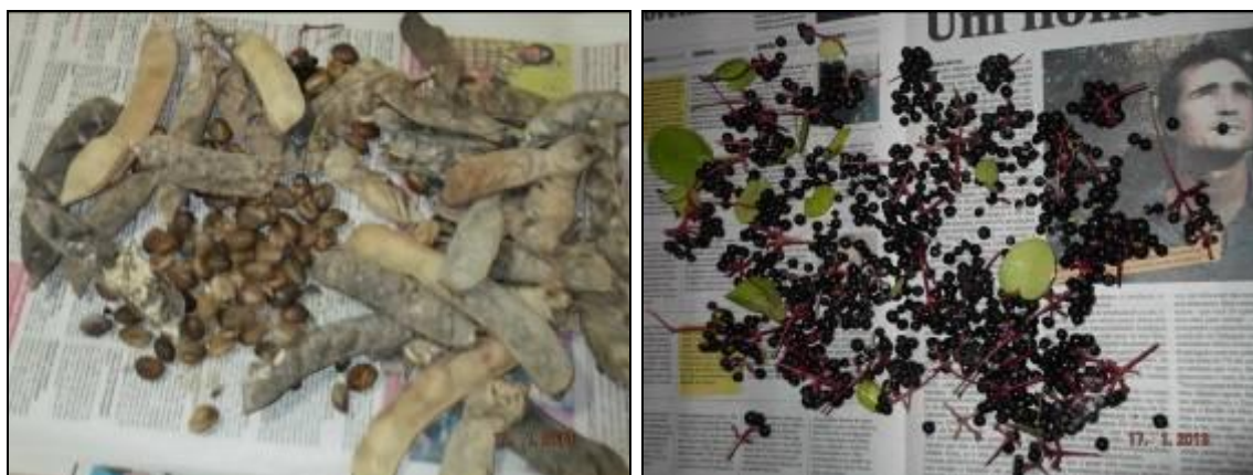
Figura III. 5-4 – Sementes de Ipomoea pes-capre (Foto a esquerda) e Guapira pernambucensis (foto a direita) para semeadura direta

O hábito estolonífero de Ipomoea pes-capre e a capacidade reprodutiva da mesma juntamente com a da Guapira pernambucensis verificada in loco (Figura III.5-2), gerou uma ação extra de plantio dessa espécie, coletando sementes dos indivíduos frutificados e lançando-as ou enterrando-as na área abaixo dos poleiros (Figura III.5-3). Essa medida visa acelerar o recobrimento do sedimento e, assim, melhorar as condições ambientais para estabelecimento de outras espécies nativas. O método de semeadura direta a pleno sol é indicado por Nave et al. (2009) como uma técnica de plantio em projetos de recuperação ambiental.