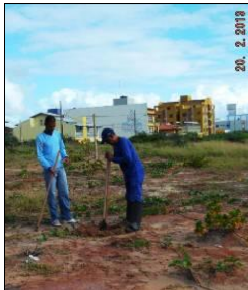
Figura III. 4-2 – Abertura das covas para o plantio.

Os plantios foram precedidos pela abertura das covas com dimensões aproximadas de 30 x 30 x 30 cm (Figura III. 4-3) seguida da aplicação de cobertura morta na superfície (Figuras III.4-4),afim de auxiliar na retenção de água, permitindo maior eficiência hídrica do plantio.