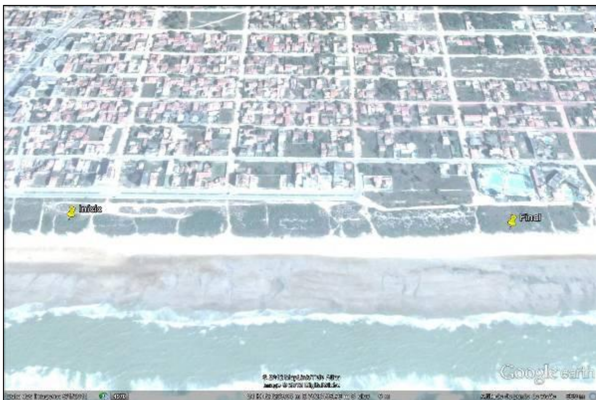
Figura III. 1.1 – Localização da área de monitoramento.

A área objeto da manutenção é composta por uma faixa litorânea situada na extremidade norte da praia de Guriri, São Mateus/ES, entre a avenida Atlântica e o mar, limitado ao norte pelas coordenadas ( UTM WGS 1984 ) 7928749N, 421292L e ao sul 7.928.088 N, 421.260 L (Figuras III.1-1).