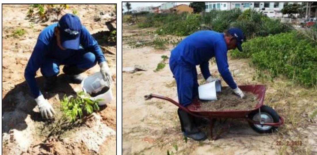
Figura III. 4-3 – Aplicação de cobertura morta nos indivíduos plantados.

Após o plantio as mudas receberam irrigação com frequência, com exceção aos dias chuvosos.