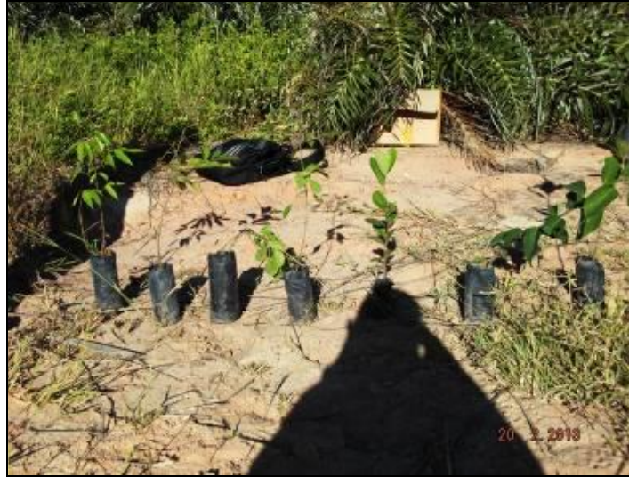
Figura III. 4-3 – Algumas espécies plantadas e suas respectivas alturas

Os plantios foram precedidos pela abertura das covas com dimensões aproximadas de 30 x 30 x 30 cm (Figura III. 4-3) seguida da aplicação de cobertura morta na superfície (Figuras III.4-4),afim de auxiliar na retenção de água, permitindo maior eficiência hídrica do plantio.