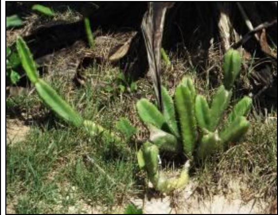
Figura III 5-7-. Novas espécies chegando a área de monitoramento. Foto à esquerda, indivíduo de Guriri e na foto à direita indivíduo de cacto.