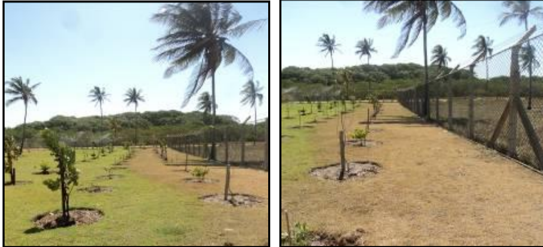
Figura III. 2-7- Imagem da área que não está sendo atingida pela irrigação mecanizada.

Foi realizada adubação de cobertura, utilizando para cada muda 50g do adubo químico de composição NPK 20-06-20 (Figura III. 2.8). Além da adição de matéria orgânica morta visando a manutenção da umidade e incorporação de nutrientes (Figura III.2.9);