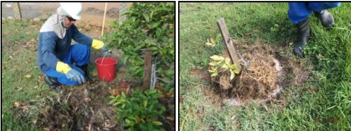
Figura III. 2-8 – Funcionários da SCITECH adicionando adubo NPK as mudas.

Foi realizada adubação de cobertura, utilizando para cada muda 50g do adubo químico de composição NPK 20-06-20 (Figura III. 2.8). Além da adição de matéria orgânica morta visando a manutenção da umidade e incorporação de nutrientes (Figura III.2.9);