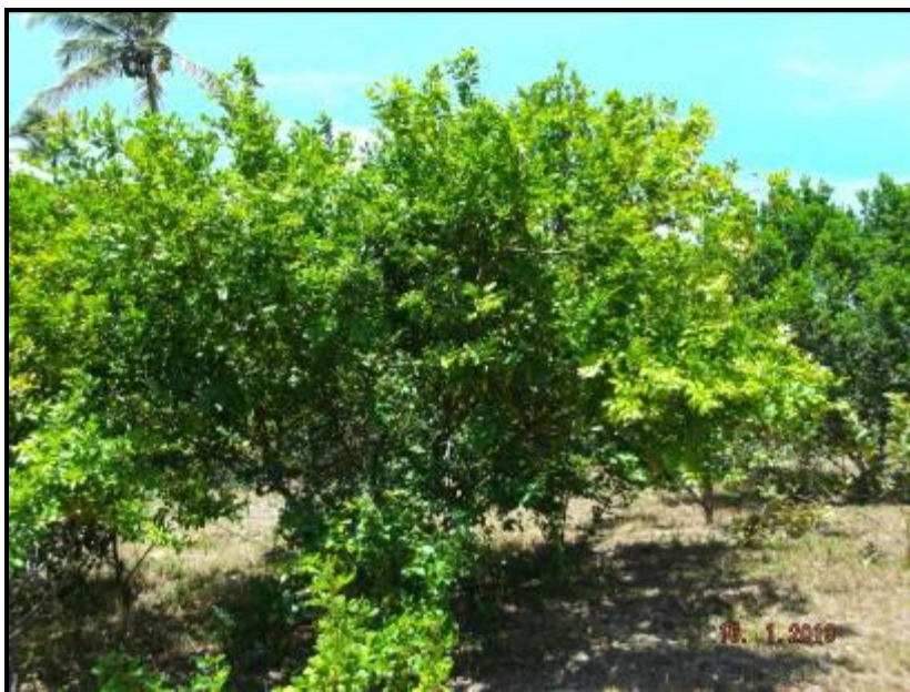
Figura III. 2-4 – Indivíduo demonstrando bom crescimento de copa e conseqüentemente cobertura do solo.

A irrigação foi realizada de forma mecanizada por aspersores e gotejamento (Figura III. 2-5) e manual como pode ser observada nas imagens abaixo (Figura III. 2-6). No entanto a irrigação feita por aspersores se encontra mal dimensionada, uma vez que não esta atingindo todos os indivíduos plantados