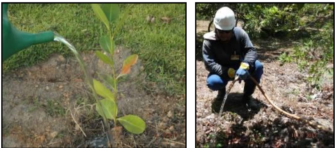
Figura III. 2-6- Imagens da irrigação feita manualmente pelos funcionários da SCITECH.