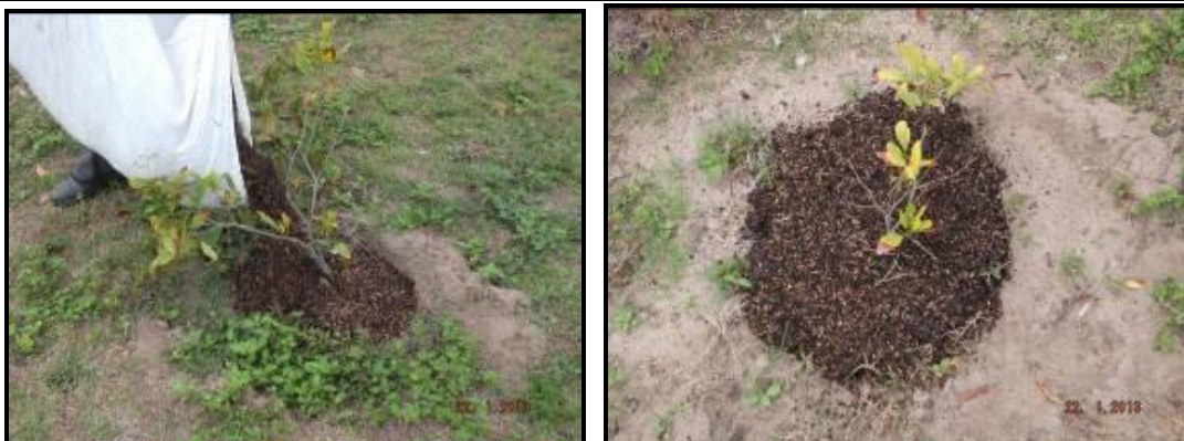
Figura III. 2-9 – Adição de matéria orgânica morta nas mudas.

Foi realizado o coroamento nas mudas periodicamente afim de reduzir a competição por nutrientes no entorno da planta com a retirada de plantas concorrentes (Figura III.2-10).