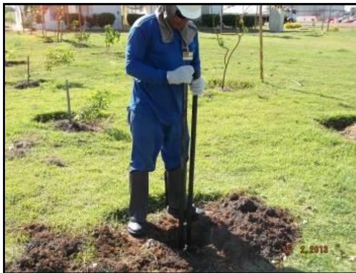
Figura III. 2-2 – Abertura de covas.

Procedeu-se a abertura das covas com dimensões aproximadas de 30 x 30 x 30 cm (Figura III. 2-2), seguida da adição de esterco bovino misturando à terra da própria cova.