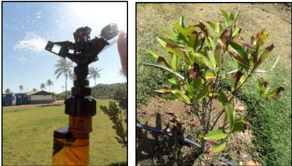
Figura III. 2-5- Imagens da irrigação mecanizada feita por aspersores (foto da esquerda) e por gotejamento (foto da direita).