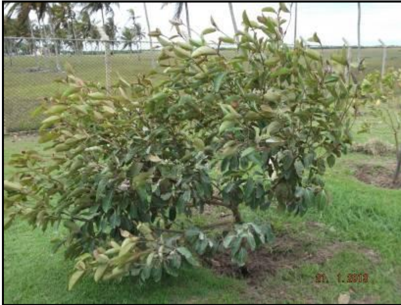
Figura III. 2-3 – Indivíduo demonstrando bom crescimento lateral.