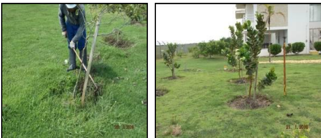
Figura III. 2.10 – Coroamentos das mudas (foto da esquerda) e mudas coroadas (foto da direita).

Foi realizado o coroamento nas mudas periodicamente afim de reduzir a competição por nutrientes no entorno da planta com a retirada de plantas concorrentes (Figura III.2-10).