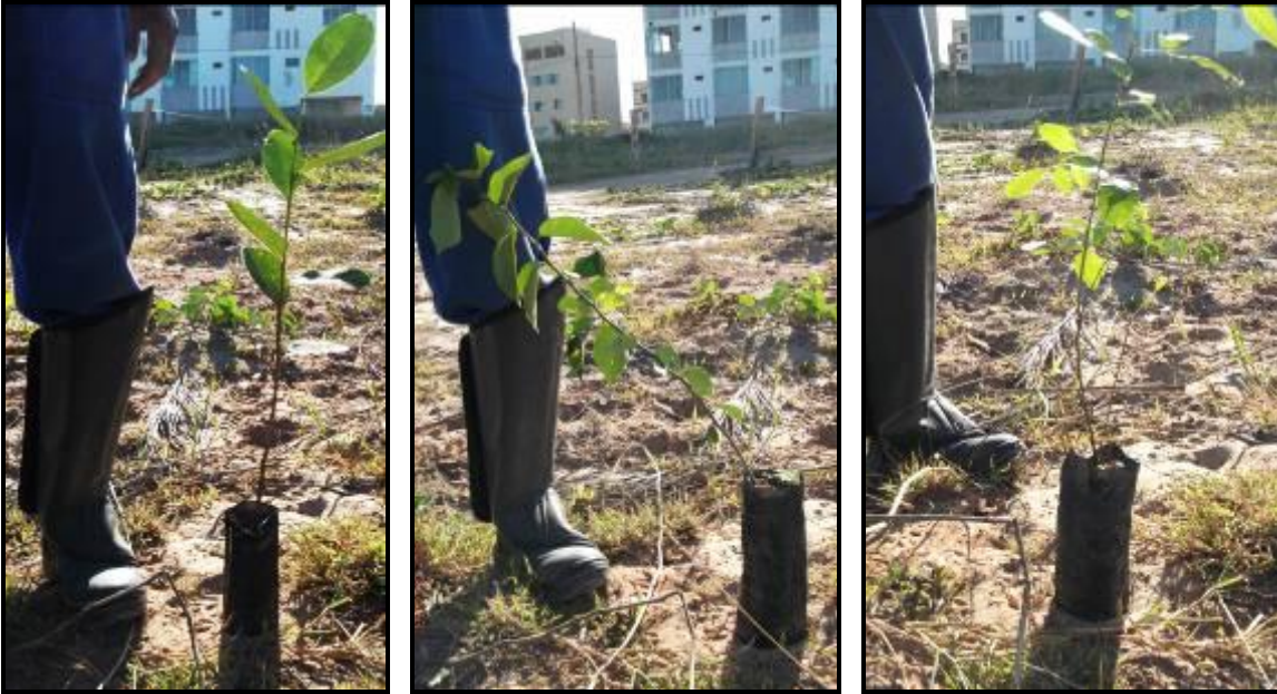
Figura III. 2-1- Imagem demonstrando a altura das mudas que foram plantadas.

Procedeu-se a abertura das covas com dimensões aproximadas de 30 x 30 x 30 cm (Figura III. 2-2), seguida da adição de esterco bovino misturando à terra da própria cova.