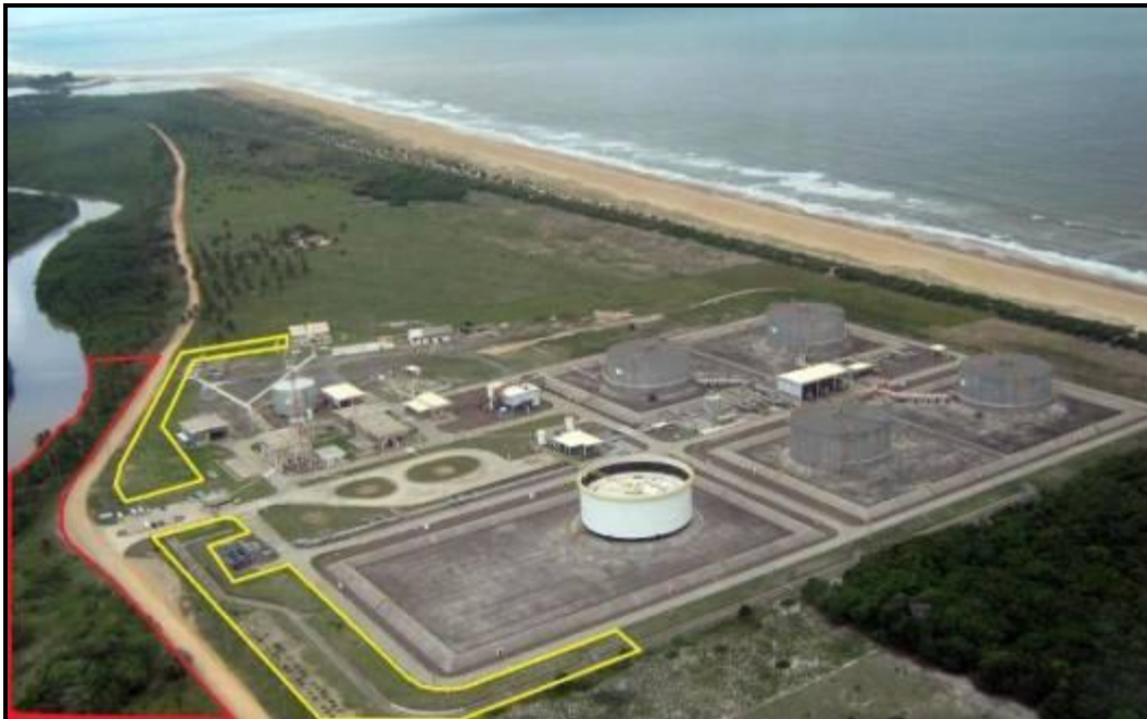
Figura III. 1-1- Localização da Cortina vegetal em amarelo e localização da recomposição da faixa de restinga em vermelho (visão aérea).

São duas as áreas objetos do monitoramento e manutenção. Uma está localizada no interior da área industrial do TNC e a outra na frente do Terminal Norte Capixaba (TNC) (Figuras III. 1-1), o qual situa-se na rodovia Campo Grande, km 08 em Barra Nova, no Município de São Mateus, ES.