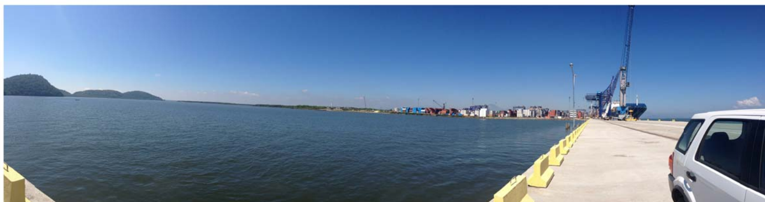
IMAGEM PANORÂMICA DO TERRENO A SER UTILIZADO PARA O FUTURO EMPREENDIMENTO