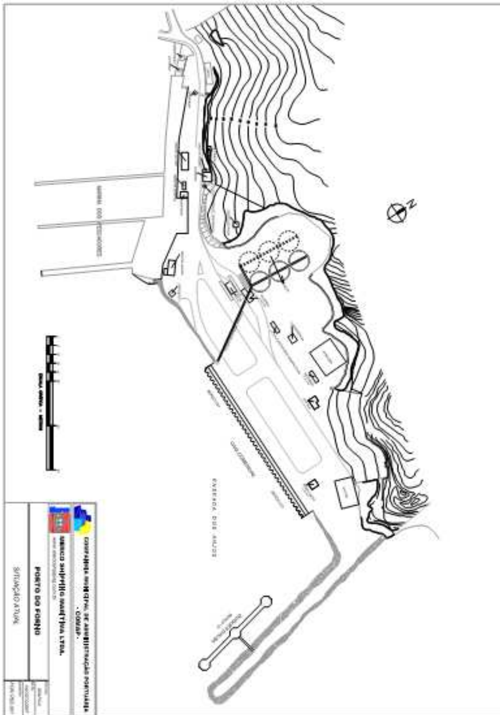
Anexo 2.1. Situação atual do Porto do Forno.