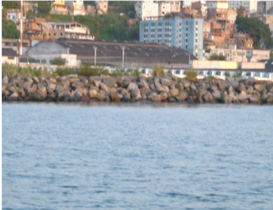
Foto 3 - Enrocamento existente na área do empreendimento