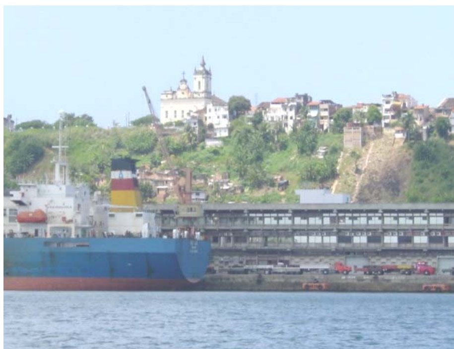
Foto 28 - Navio descarregando trigo e fila de caminhões que circulam no Porto para recebimento da carga de trigo.