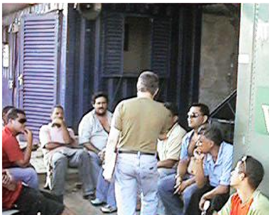
Foto 32 - Entrevista com os motoristas que aguardam para o descarregamento dos contêineres