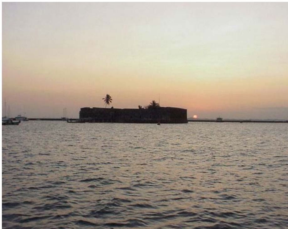
Foto 12 - Forte São Marcelo no extremo sul do Porto