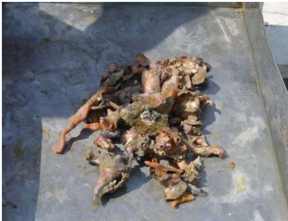
Foto 48 - Conchas e calcários obtidos na coleta com Van Veen