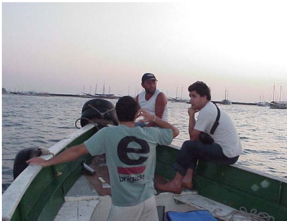
Foto38 - Parte da equipe de campo