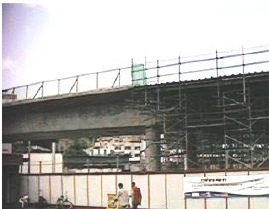
Foto 23 - Obras da alça de acesso a área da CODEBA