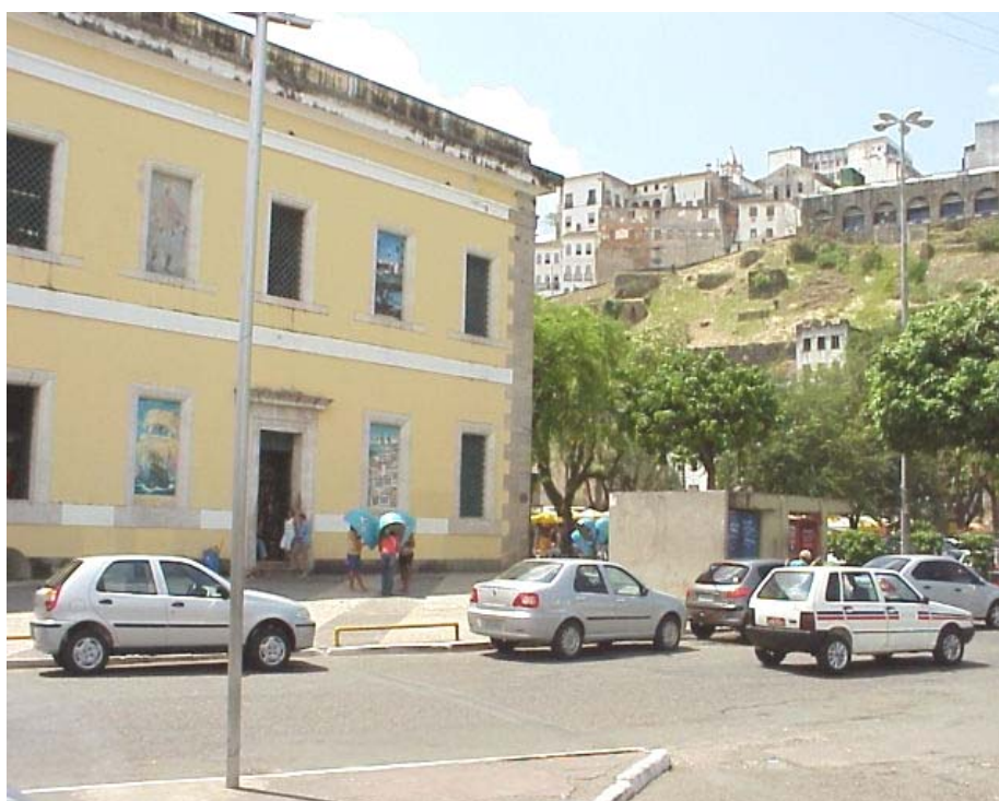
Foto 13 - Lateral do Mercado Modelo