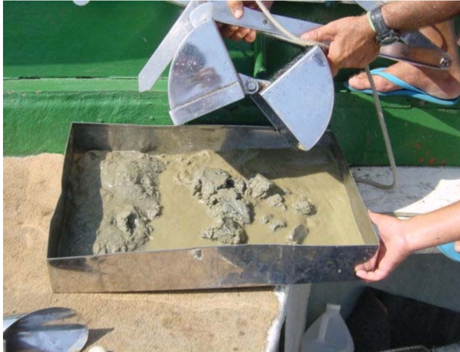
Foto 45 - Descarregamento da draga com substrato lodoso