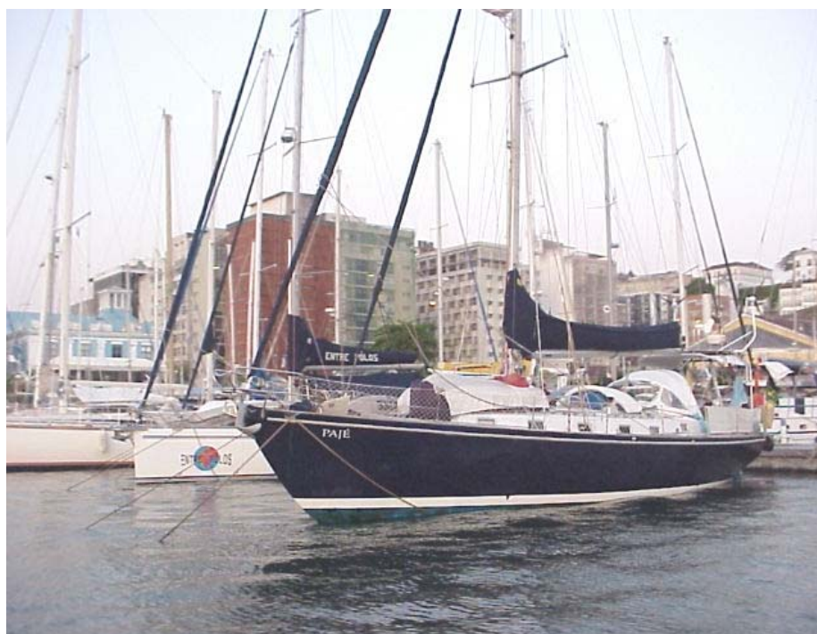
Foto 24 - Barcos de recreação fundeados no late Clube de Salvador, a sul da área do Porto