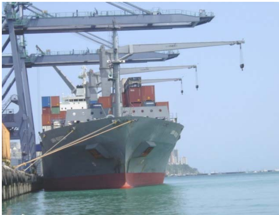
Foto 34 - Navio sendo carregado com contêineres no Tecon. Observar os portaineres.