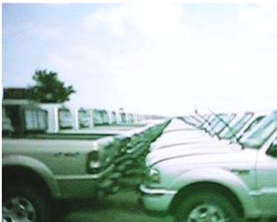
Foto 5 - Pátio de estocagem de veículos a serem embarcados