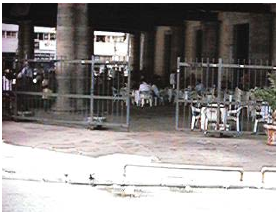
Foto 14 - Frente do Mercado Modelo