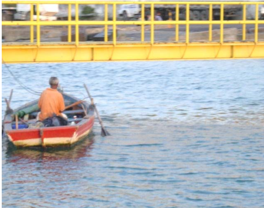
Foto 17 - Pescador da região na área do Porto próximo ao empreendimento