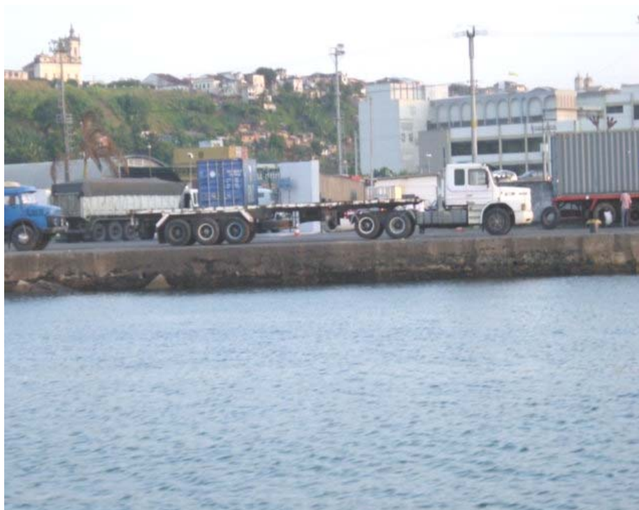
Foto 29 - Caminhões com contêineres