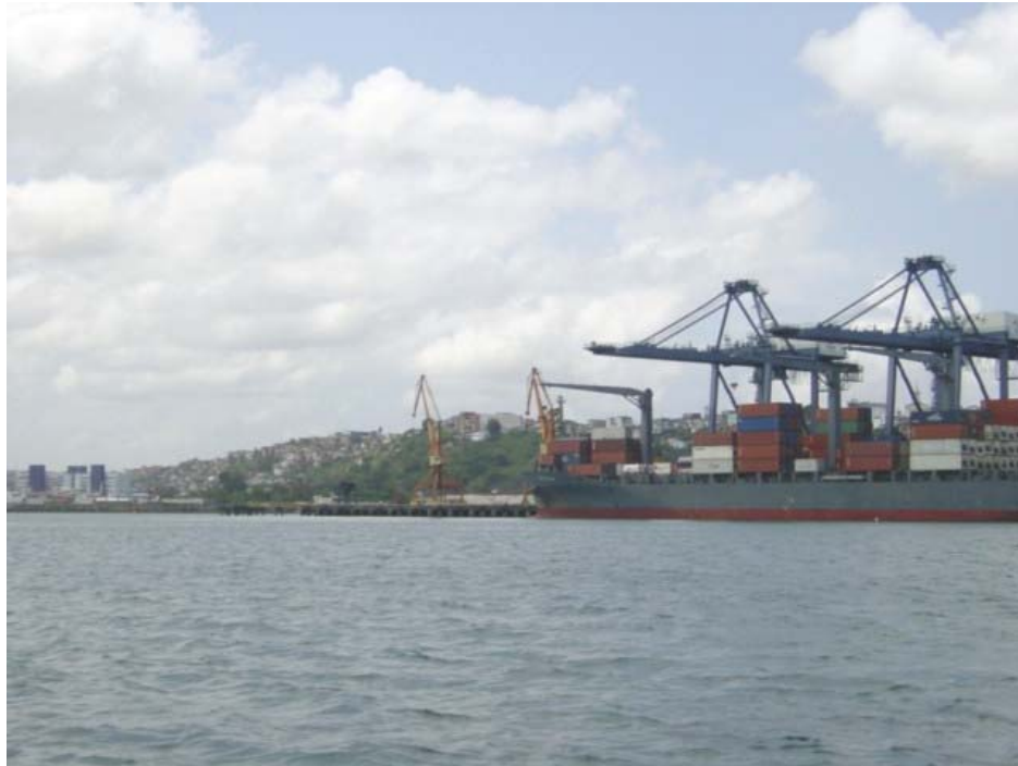
Foto 33 - Tecon - em primeiro plano portaineres, em segundo guindastes