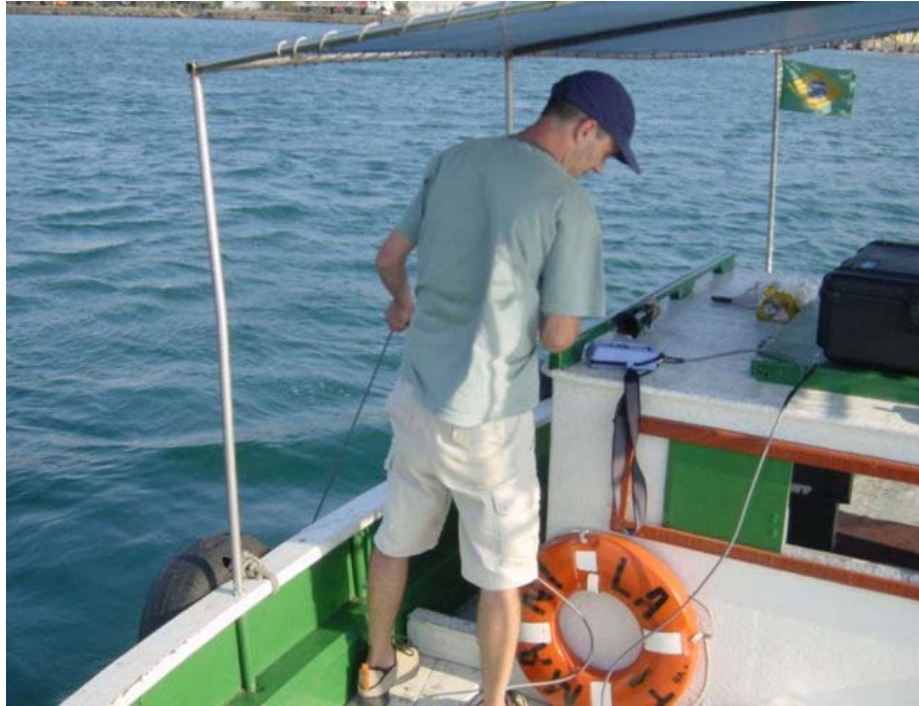
Foto 43 - Leitura do Horiba