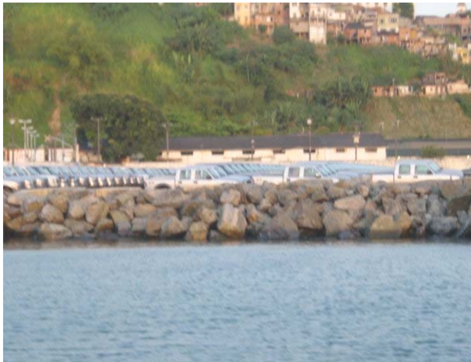
Foto 4 - Enrocamento existente na área do empreendimento e, ao fundo, pátio de estocagem de veículos