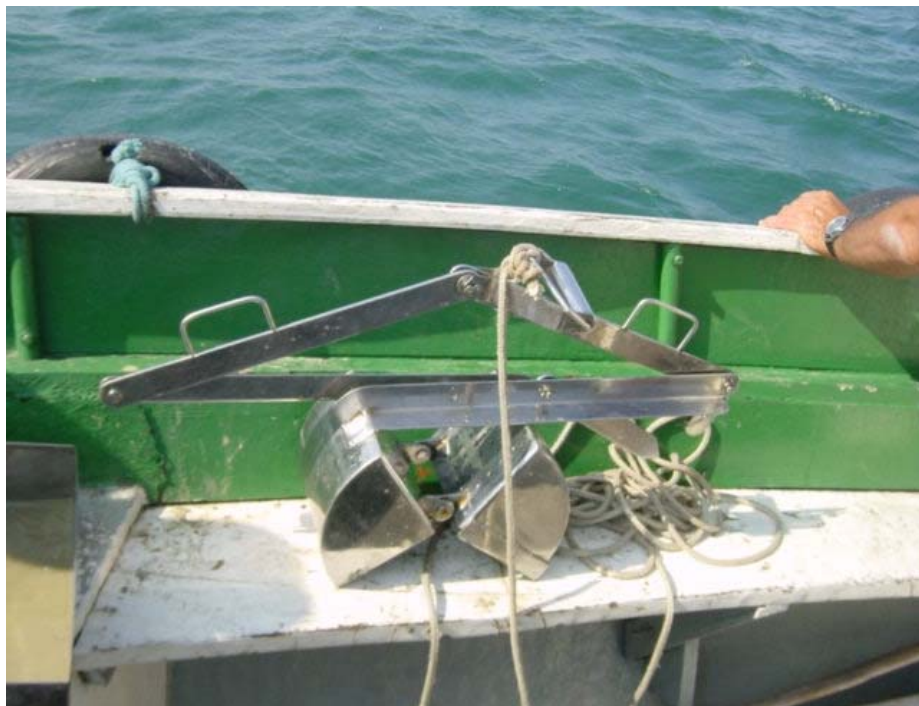
Foto 40 – Amostrador de caçamba “van Veen”. utilizado na coleta de sedimento de fundo