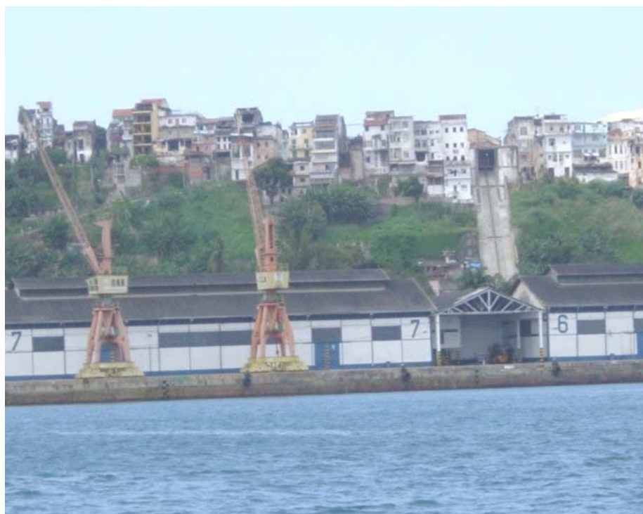
Foto 27 - Porto de Salvador - armazéns 6 e 7