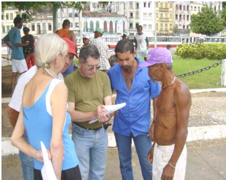
Foto 16 - entrevista com a comunidade de pescadores na região do Mercado Modelo