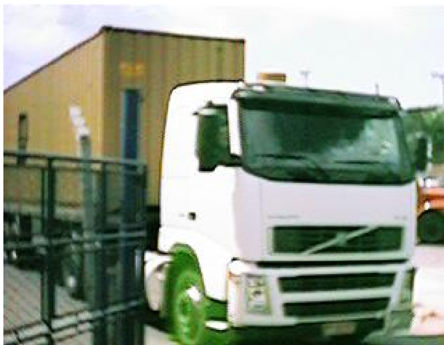
Foto 31 - Caminhão transportando contêiner para dentro do Porto