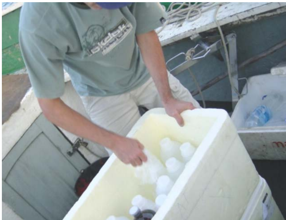
Foto 50 - Detalhe do acondicionamento de água para análise