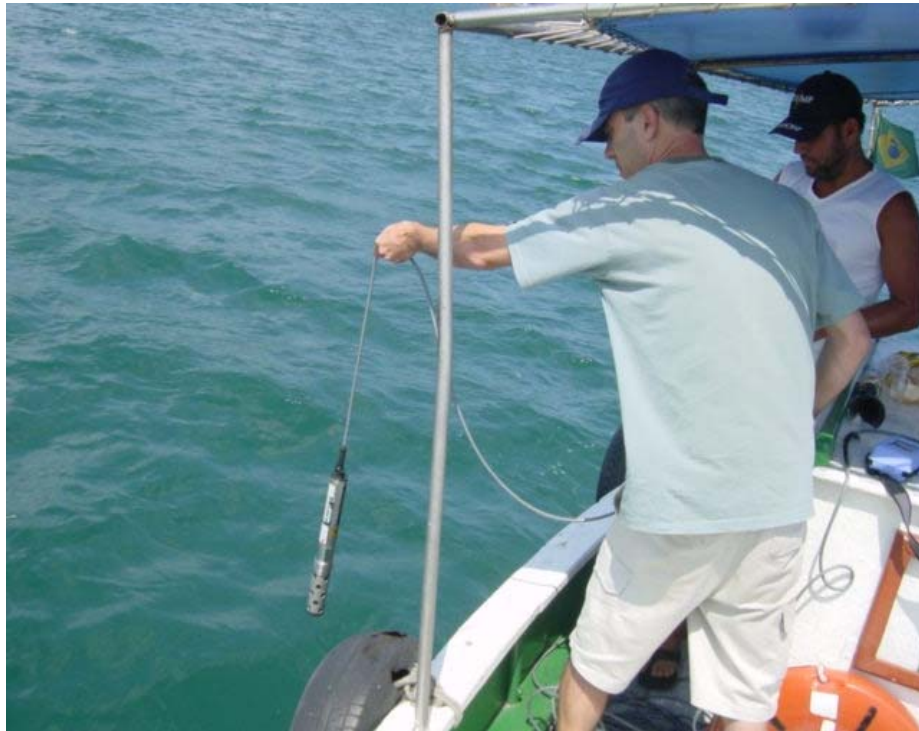
Foto 41 – Aparelho multiparâmetros Horiba para coleta de dados físicos