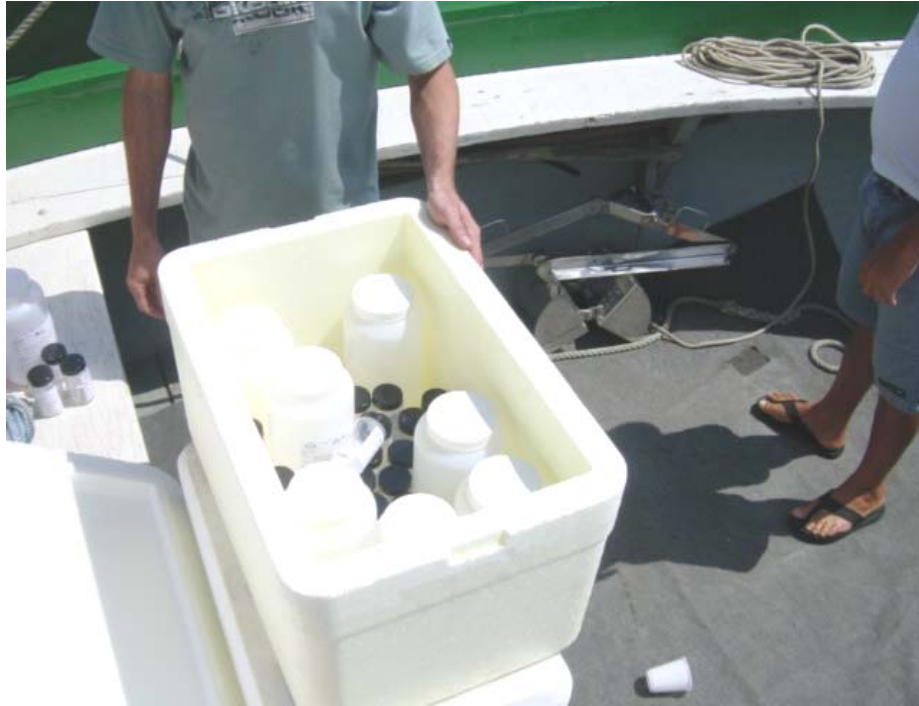
Foto 49 - Amostras de água acondicionadas para transbordo