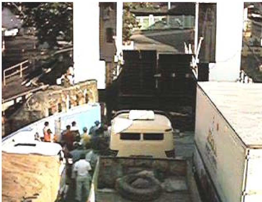
Foto 18 - Cais de atracação do ferry boat ao norte da área do empreendimento