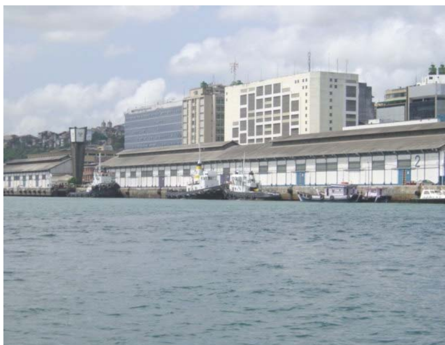
Foto 26 - Porto de Salvador - armazéns 2 e 3