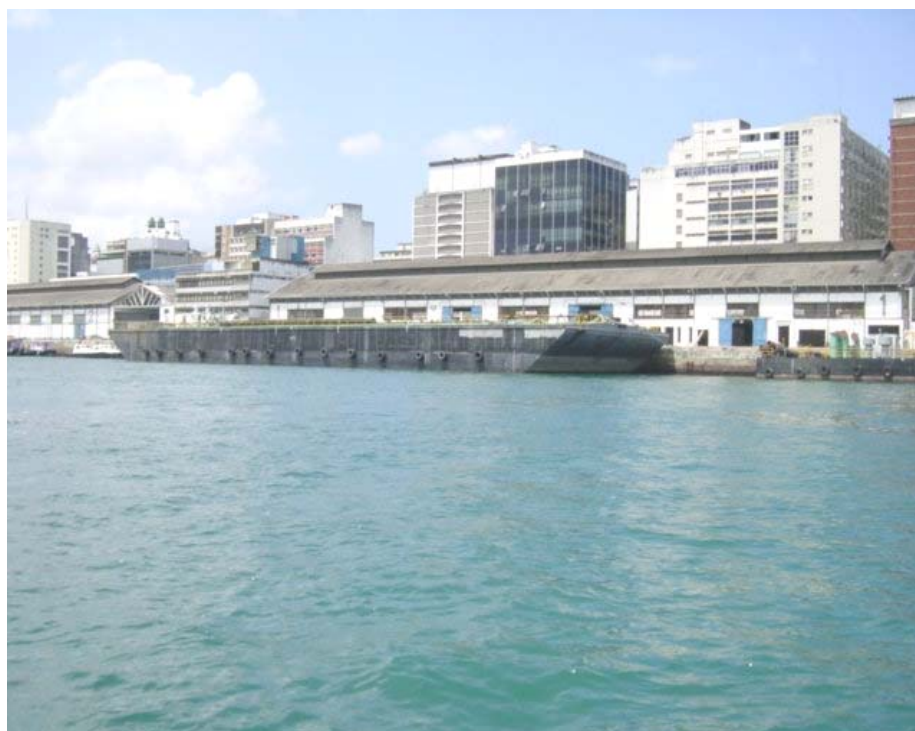
Foto 25 - Porto de Salvador - armazéns 1 e 2