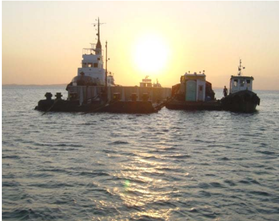
Foto 7 - Boia de atracação, rebocador e embarcações auxiliares