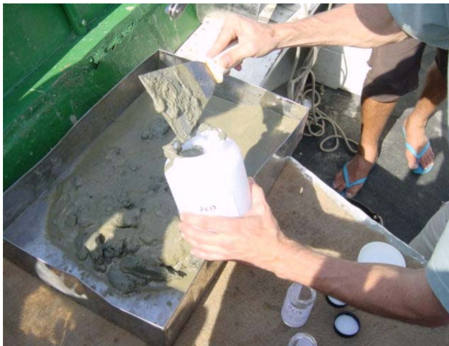
Foto 46 - Acondicionamento de amostras de substrato