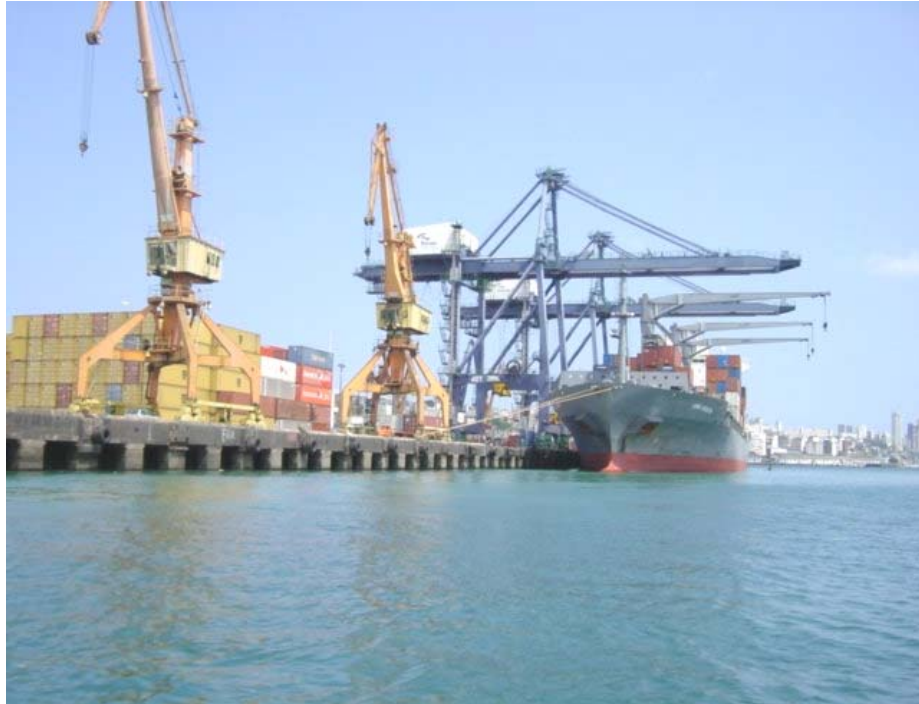
Foto 37 - Vista do pátio de contêineres do Tecon com navio sendo carregado. Observar os portêineres em segundo plano, em primeiro plano, guindastes do terminal público