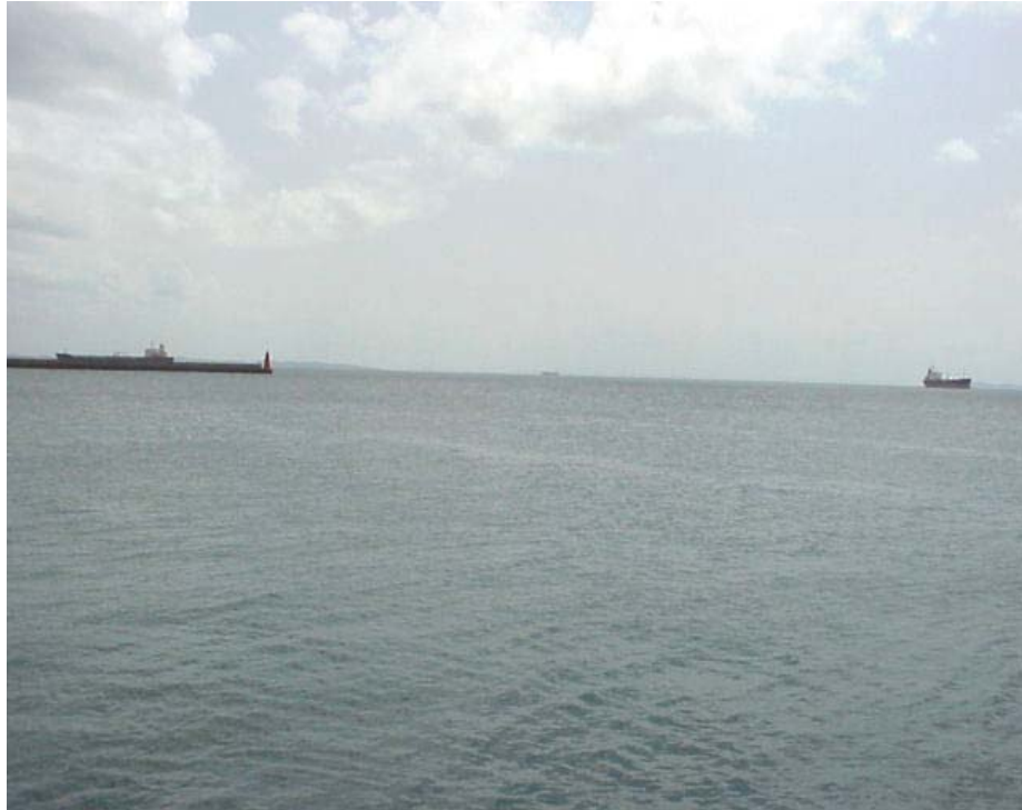
Foto 35 - Extremo norte do quebra-mar.