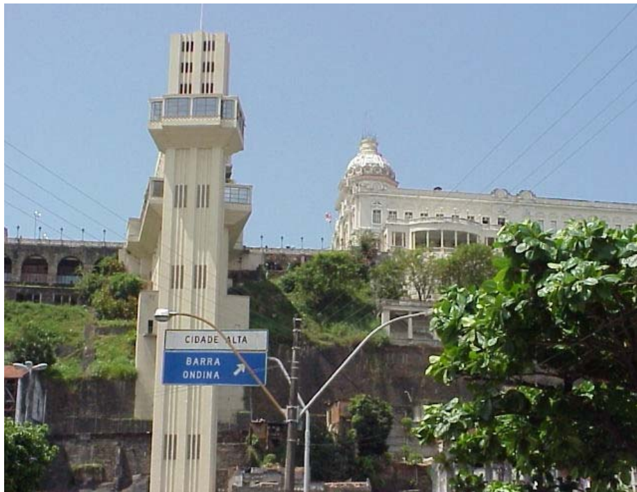
Foto 11 - Elevador Lacerda que liga a Cidade Baixa com a Cida Alta. Ao fundo, na Cidade Alta, o antigo palácio do Governo