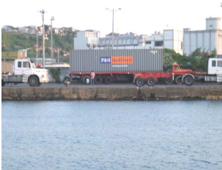
Foto 30 - Caminhões com contêineres aguardando o descarregamento.