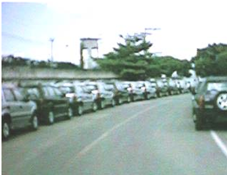
Foto 6 - Veículos a serem embarcados, fora do pátio de estocagem