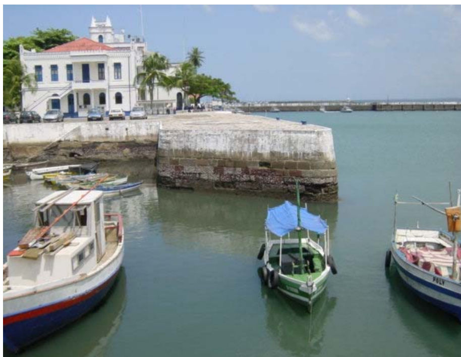
Foto 10 - Capitania dos Portos de Salvador