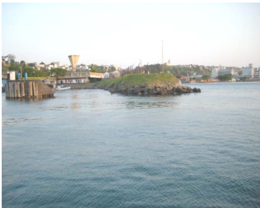
Foto 21 - À esquerda, cais dos ferry boats, a direita local do empreendimento