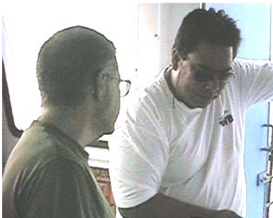
Foto 20 - Entrevista da equipe de campo com o comandante do ferry boat