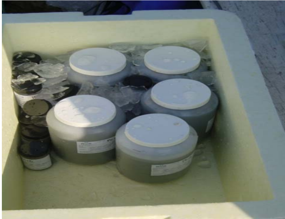
Foto 47 - Substrato lodoso acondicionado e embalado para transbordo