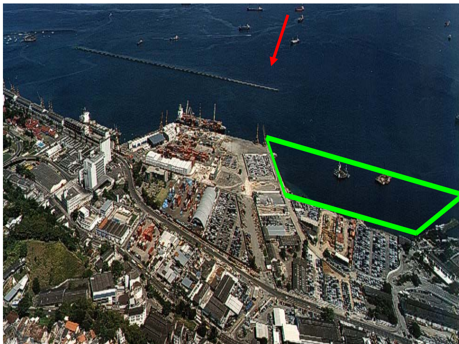
Foto 1 - Área do empreendimento (assinalada em verde). Vista do Tecon e parte dos armazéns do Porto. A seta vermelha aponta para o extremo norte do quebra-mar