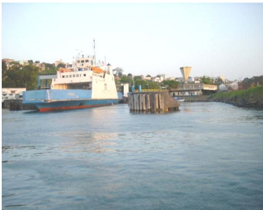
Foto 22 - Ferry boat atracado no terminal de São Joaquim