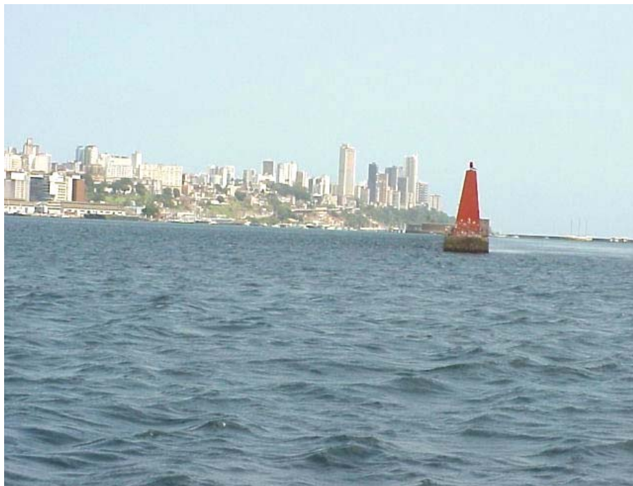
Foto 36 - Detalhe do extremo norte do quebra-mar com farolete de sinalização