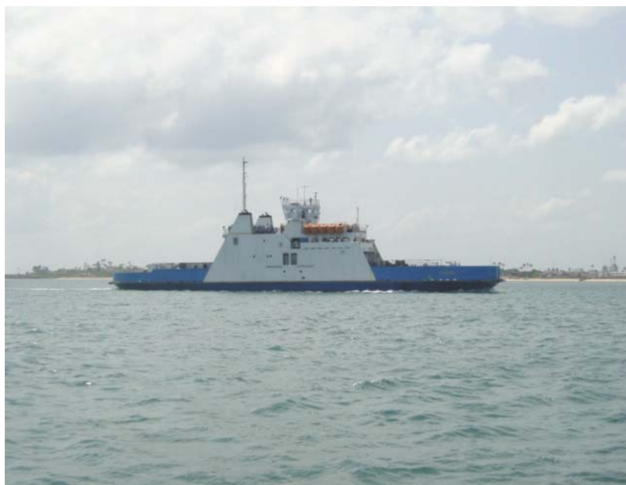
Foto 19 - Ferry boat retornando de Itaparica