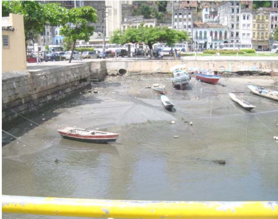
Foto 15 - Maré baixa na área do Mercado Modelo