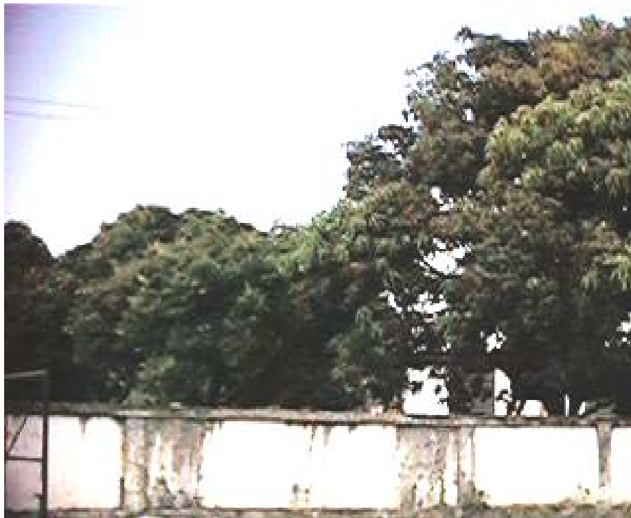
Foto 8 - Mangueiras dentro da área do empreendimento. Uns dos poucos exemplares de flora terrestre dentro do local do empreendimento.