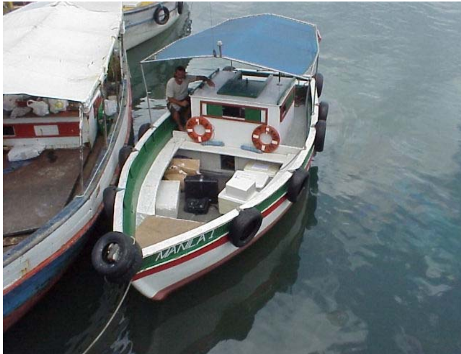
Foto 39 - Embarcação utilizada na coleta com as vidrarias acondicionadas em caixas de isopor, já embarcadas