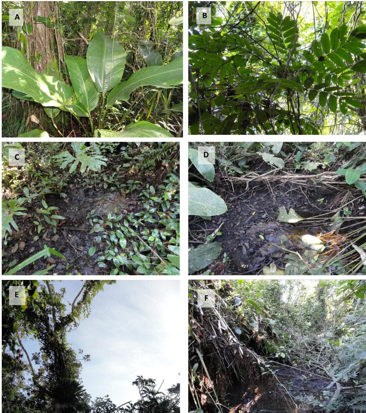
Figura 2.1. Registro fotográfico de: A) Espécie característica Calophyllum brasiliense Cambess.; B) Espécie característica Tapirira guianense Aublet; C) Serrapilheira em decomposição avançada; D) Camada superficial do lençol freático.; E) Registro comum de clareira formada pela queda de árvores; F) Raízes arrancadas e solo exposto pela queda de árvores.