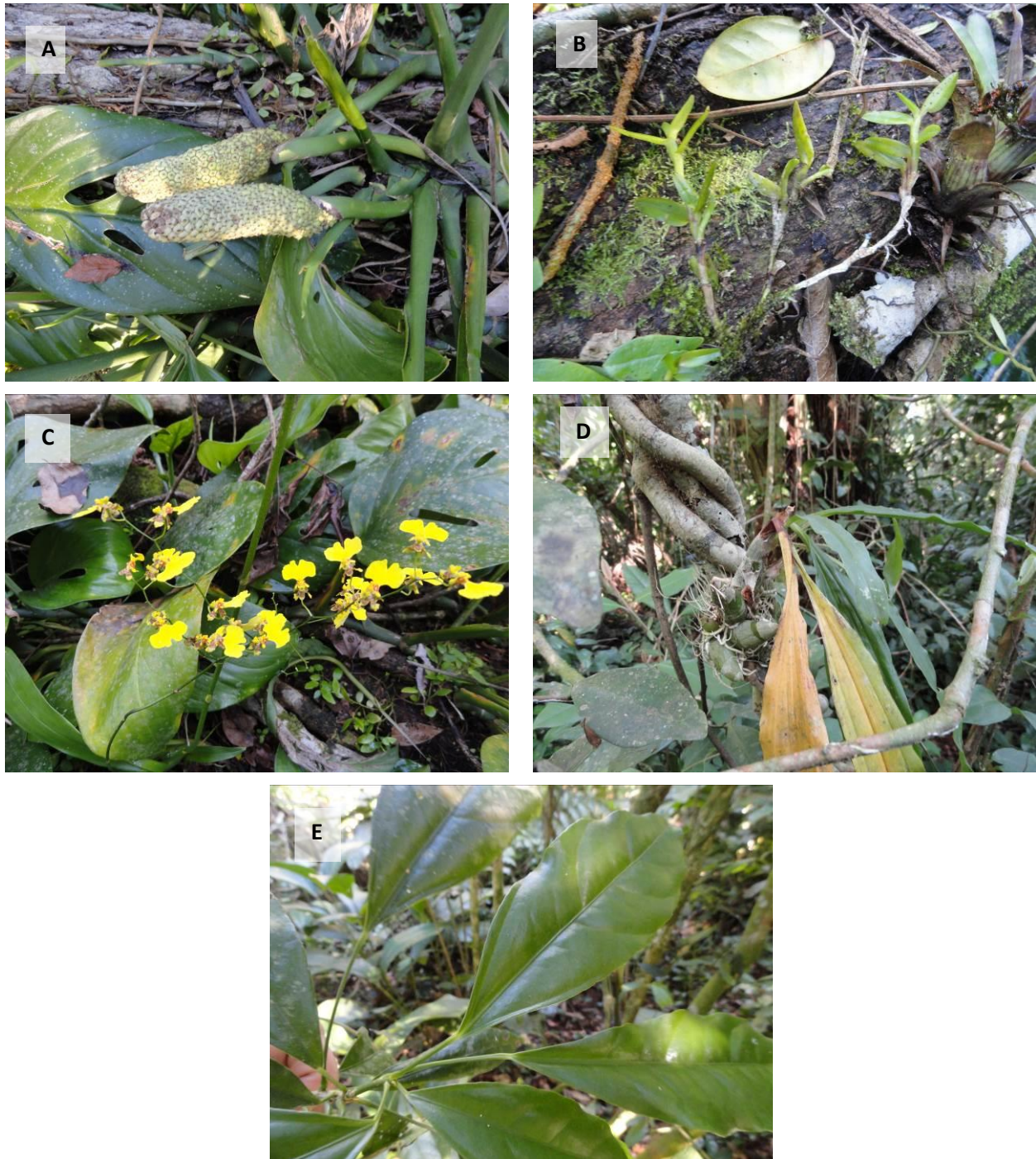
Figura 2.5. Registro fotográfico de: A) Monstera adansonii Schott; B) Epidendrum cf. rigidum Jacq.; C) Gomesa flexuosa (Sims) M.W.Chase & N.H.Williams; D) Catasetum cf. atratum Lindl.; E) Dendropanax australis Fiaschi & Jung-Mend.