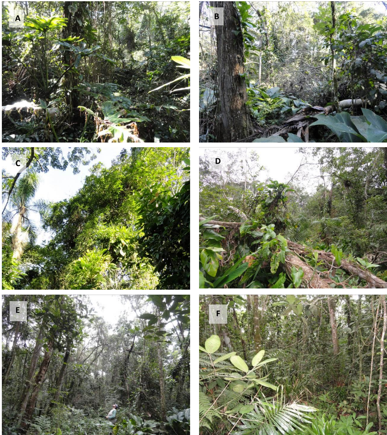
Figura 2.2. Registro fotográfico de: A) Parcela 01 – Fisionomia arbórea e demais estratos bem desenvolvidos; B) Parcela 02 – Clareira formada pela queda de árvores; C) Parcela 04 – Aspecto da barda de clareira no interior da mata; D) Parcela 05 – Registro próximo de outra clareira; E) Parcela 07 – Fisionomia arbórea com presença de lianas herbáceas; F) Parcela 09 – Grande abundância de Nidularium spp. e sobosque bem desenvolvido.