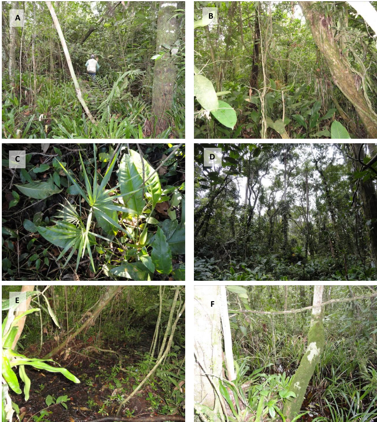
Figura 2.3. Registro fotográfico de: A) Parcela 11 – Estrato dominado por Nidulium innocentii Lem.; B) Parcela 13 – Sub-bosque com abundância de lianas e epífitas; C) Plântula de Euterpe edulis em regeneração em solo enxuto; D) Aspecto dos estratos florestais em solo encharcado; E) Aspecto do sub-bosque em solo encharcado; F) Solo encharcado dominado por Rhynchospora sp.