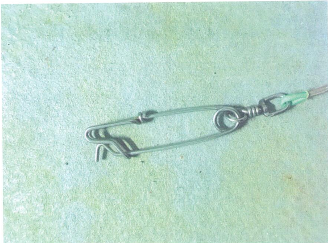
Figura 3 – Petrecho de pesca retirado do cabo sísmico (snap).