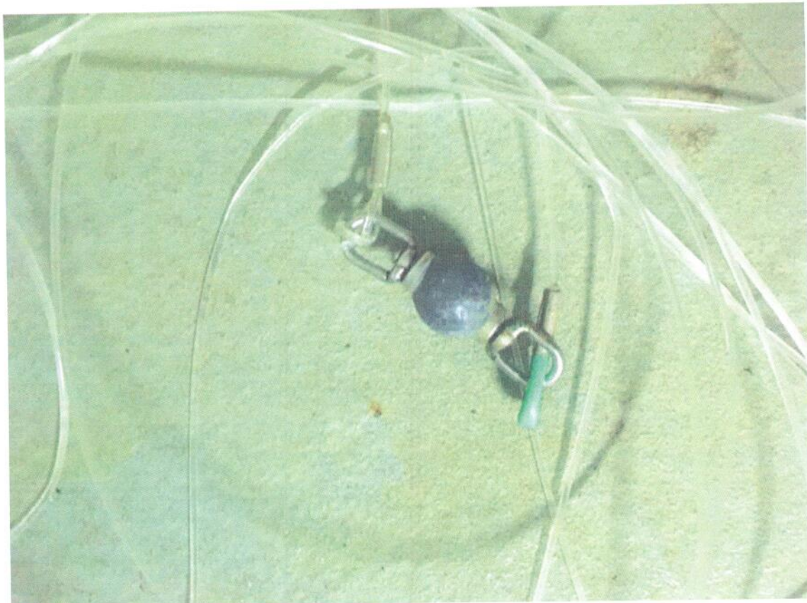
Figura 2 – Petrecho de pesca retirado do cabo sísmico (girador).