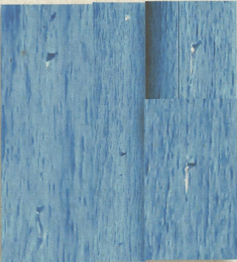
Delfínideo, NPN 129, 21/12/2013