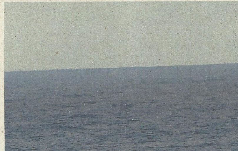
Western Neptune - 16 de julho de 2013