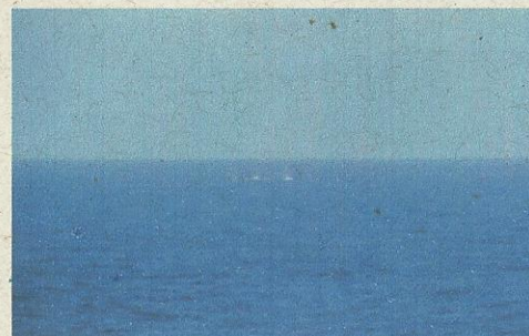
Western Neptune - 14 de julho de 2013

Às 12h45 foram avistados borrfifos de um grupo de oito mysticetos, pelo través de bombordo da embarcação sísmica Western Neptune, fora da área de sobreaviso. O grupo estava em deslocamento lento no sentido bombordo-boreste, sendo avistado pela última vez às 13h20 à aproximadamente 3,0 MN da popa da embarcação. Avistagem realizada no Campo de lara.