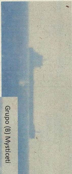
Grupo (B) Mysticeti