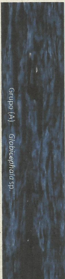
Grupo (A) Globicephala sp.