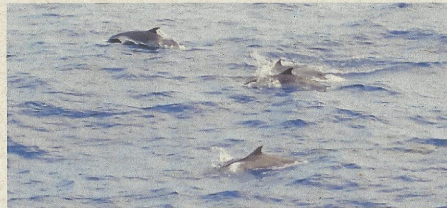
Western Neptune - 27 de abril de 2013 - 08h51