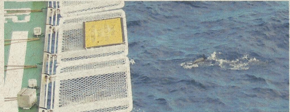
Western Neptune - 27 de abril de 2013 - 08h50