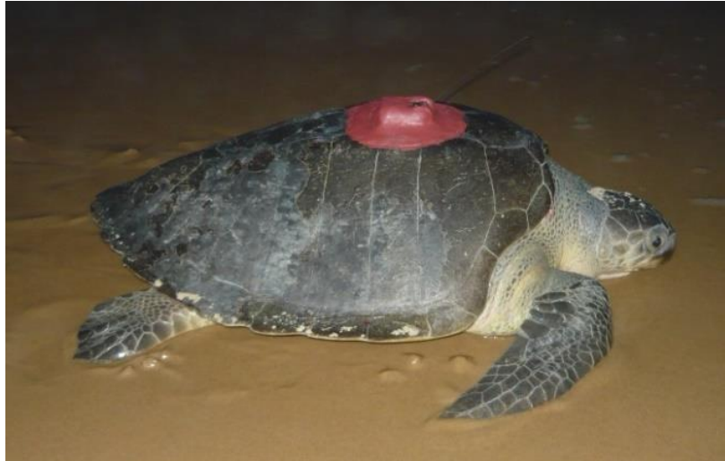
Tartaruga-oliva ( Lepidochelys olivacea )

zonas costeiras ao longo da plataforma continental desde o Espírito Santo até o Pará, além de migrações para regiões equatoriais do Atlântico (DA SILVA et al. 2011).