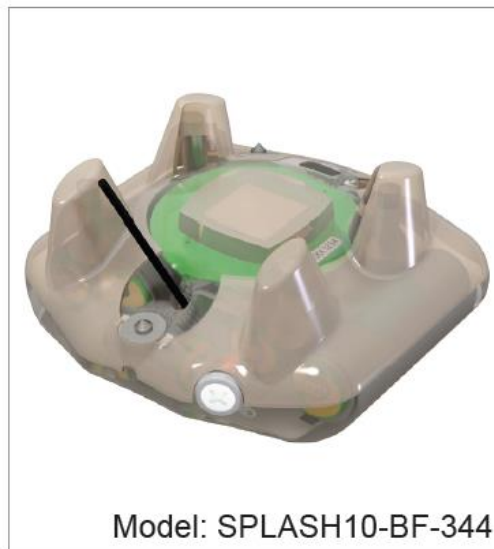
Figura ilustrativa do modelo de transmissor da © Wildlife Computers