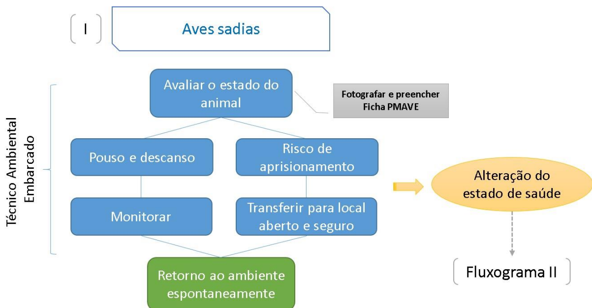
Fluxograma I – Procedimentos para aves saudáveis

As aves serão inicialmente fotografadas e seu estado geral será observado. As informações sobre o estado do animal e comportamento serão registradas no Formulário do PMAVE com os seguintes propósitos: i) conhecimento das espécies que utilizam a embarcação para pouso e repouso; e ii) registro das informações básicas caso a ave altere seu estado de saúde durante a permanência a bordo e necessite de atendimento.