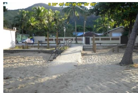
Acesso à Praia das Cigarras