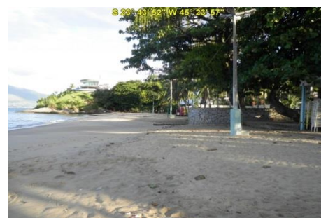
Praia das Cigarras