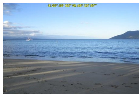
Praia das Cigarras