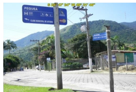
Acesso à Praia Pequeá