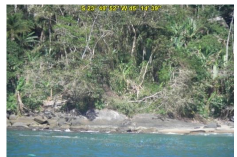
Praia de Guanxuma