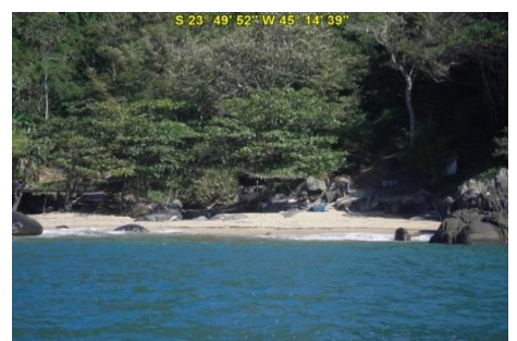
Praia de Guanxuma