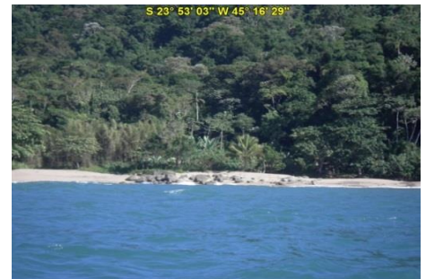
Praia da Figueira