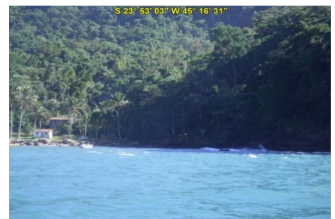
Praia da Figueira