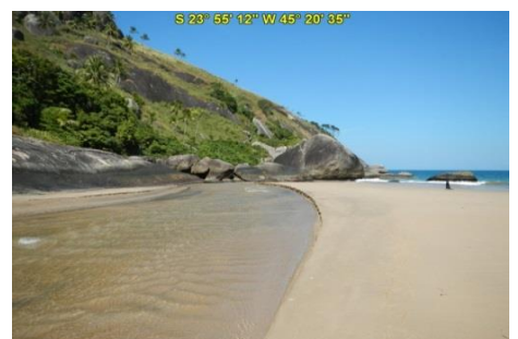
Foz de rio na Praia do Bonete