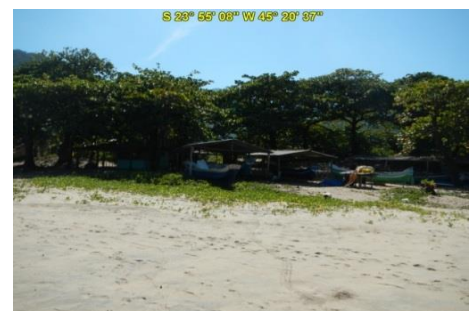
Praia do Bonete