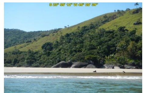
Praia do Bonete