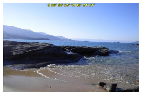
Praia do Oscar