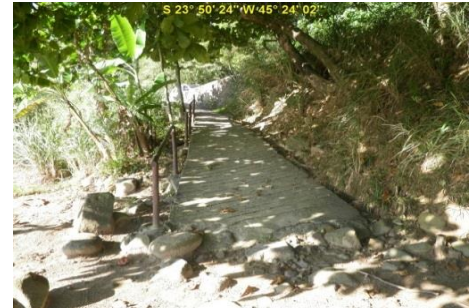
Acesso à Praia do Oscar