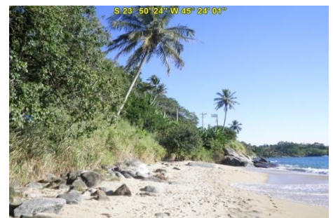
Praia do Oscar