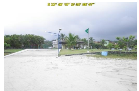
Praia de Guaratuba