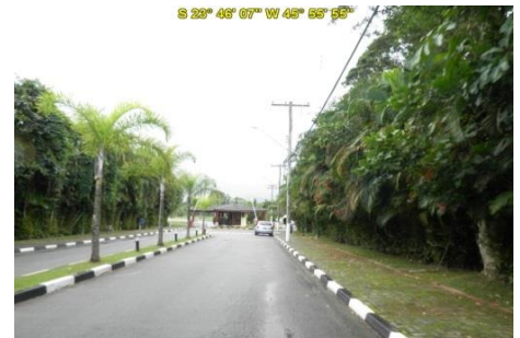
Acesso à Praia de Guaratuba