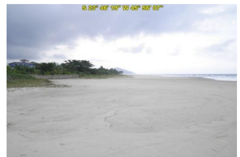
Praia de Guaratuba