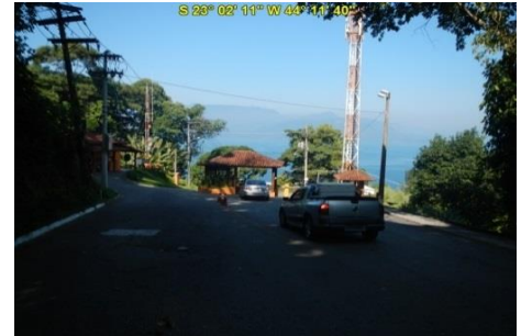
Guarita do condomínio Portugal