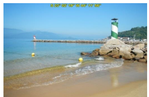
Enrocamento na Praia da Areia