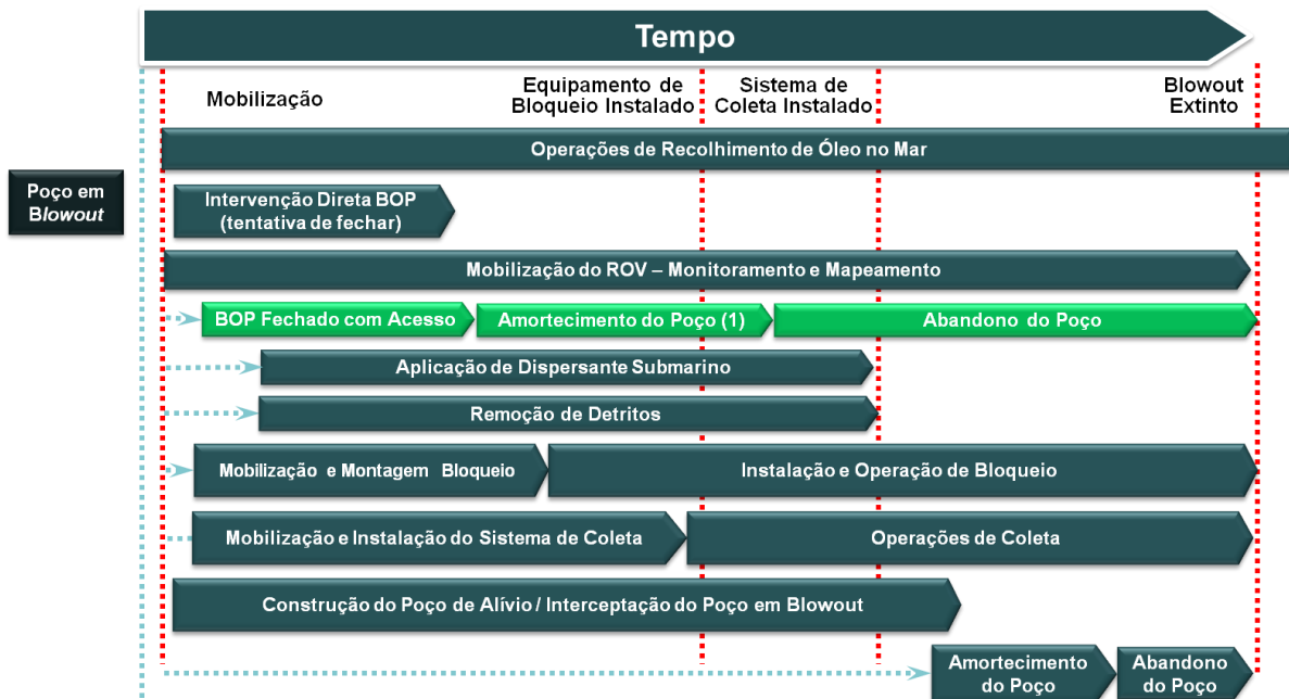
Figura I-1 – Sequência Genérica para Ações de Resposta para Combate a Blowout Submarino

A figura I-1 apresenta uma ordem cronológica de eventos mais prováveis de ocorrerem para o controle do blowout .