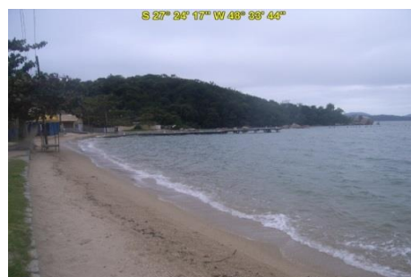
Praia Costeira da Armação