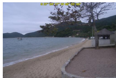
Praia Costeira da Armação