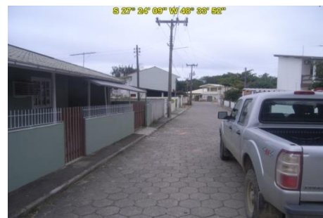
Acesso à Praia Costeira da Armação